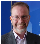
澳洲自由民主党联邦参议员 斯潘德

“法轮功是一个非常简易、平和的功法。在远方的人，包括我这个自由民主党参议员，认为你们有权利拥有自己的信仰……法轮大法真善忍的理念十分重要。尤其是善，也是我们自由民主党的主要理念之一。”