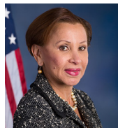
美国纽约州国会议员 贝拉斯克斯

“我们在美国公开地庆祝法轮大法的时候，世界上还有一些地区迫害如此和平的修炼方法。我期待着有一天在世界所有地方都能自由地修炼这个优美的功法。”