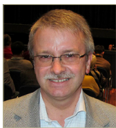
欧洲议会议员 米歇尔·加勒

“真、善、忍是普世价值，在基督教、政治层面以及日常生活中都可以找到各自对应的名称。”“我衷心祝愿每位法轮功修炼者都有美好的未来，无论在中国还是在海外。”