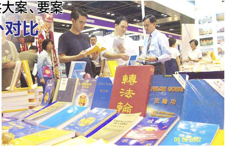
▲2002 年的年度世界书展在新加坡举行，图为展位中的《转法轮》。