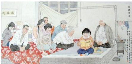
▲绘画：村民一起读法轮功书籍

据悉便衣警察对这几位法轮功学员家蹲坑监视了一段时间，把他们聚集读书的行为定为“大案”、“要案”，中央督查组、山西省公安厅、太原市公安局联合办案。