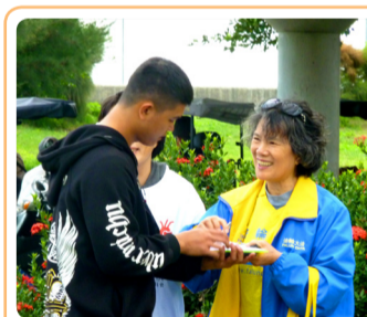
◎ 台湾法轮功学员给大陆游客讲真相。在世界很多著名景点，法轮功学员讲真相的身影到处可见。