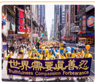
◎ 来自世界各地 8 千多名法轮功学员，举行盛大游行，把法轮大法的美好传递给纽约曼哈顿民众。

还有一次，丽琴在医院门口发明慧真相年历，过来两位警察说：“给我们两本。”丽琴把年历递给他们，并问他们是否入过中共党、团、队，警察说：“都入过，帮我们都退了。”丽琴说：“好，祝你们平安！请记住诚念‘法轮大法好、真善忍好’得福报。”警察说：谢谢！旁边人看警察都来要法轮大法资料，都围上来要资料，做“三退”（退出中共党、团、队）。丽琴帮他们都做了“三退”，祝福他们选择了美好的未来。