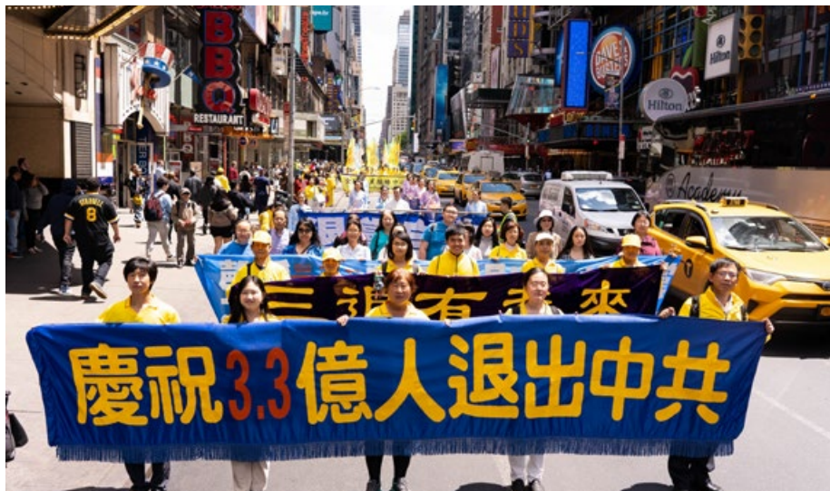
2019年5月16日，万名法轮功学员美国纽约大游行。

有人可能说“自己心中退党就算退了，不必声明”；还有人认为“自己多年没交党费了，就算自动退党了”；或者认为“年龄大了，已经自动退团、退队了”。但这都无法解除加入中共时发下的毒誓。而天灭中共时，没有解除这个毒誓的人，就将成为中共的陪葬。只有采取公开的方式退出，有行为的表示，才能解除那个“毒誓”。神看人心，只要真心声明“三退”，用真名、化名、小名皆可。