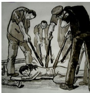
▲ 酷刑示意图：多根电棍电击

在禁闭室，警察时常以电警棍相威胁，把我按到床上灌食、输液，我的鼻子经常被捅出血。一个女警察凶残地叫嚣：“灌死她，把她扔到大烟筒里去”。警察时常对我拳打脚踢，往我嘴里塞擦例假的脏卫生纸，用木棍蘸上