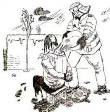
▲ 酷刑示意图：浇凉水

在一天黑夜，他们拿着复读机把我劫持到野外河滩的一个坟场，把我铐树上，戴上耳机迫使我听复读机里恐怖的鬼叫。一个小时后，见我毫无惧色，又说要把我扔到河里去，抓住我的头往水里按，边按边问改不改，我坚定地说：“法轮大法好！”他们就扯下一个树枝使劲抽打我。之后把我押回劳教所二楼，把棉衣扒掉只剩薄薄的内衣，打开电风扇吹着往身上浇凉水。