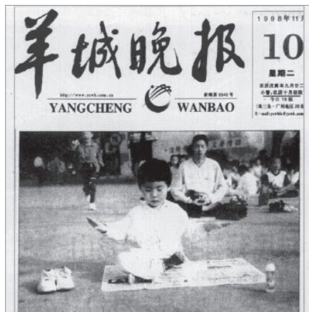
《羊城晚报》：老少皆炼法轮功 (1998年11月10日)

武汉市、大连地区分别由当地医学界组织进行了五次医学调查，调查人数近3.5万人，调查结果显示修炼法轮功的祛病健身总数有效率高达98%。