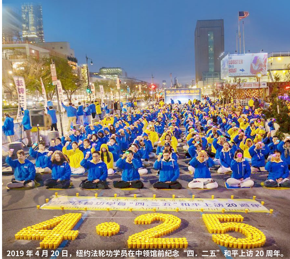
2019 年 4 月 20 日，纽约法轮功学员在中领馆前纪念“四·二五”和平上访 20 周年。

1999 年 4 月 25 日，万名中国法轮功学员为了维护对“真善忍”的信仰到国务院信访局和平上访，法轮功学员展现出的崇高道德操守和非凡勇气，令世界瞩目，成为时代典范。20 年来，法轮功真相传遍世界，越来越多的人摆脱中共谎言欺骗，走向美好未来。