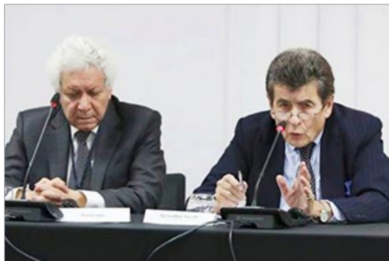
伦敦独立人民法庭主席尼斯爵士（图右）