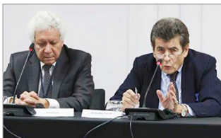
伦敦独立人民法庭主席尼斯爵士(图右)

信中提到，尼斯爵士曾在海牙国际法庭主导对塞尔维亚前总统斯洛博丹·米洛舍维奇的审判。预计独立法庭将于几个月后作出最后判决，届时犯罪者更多的罪行将曝光于天下。