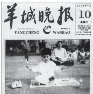
《羊城晚报》：老少皆炼法轮功 (1998年11月10日)

1998年5月以来，国务院将气功和人体科学归口到国家体育总局统一管理。国家体育总局对法轮功进行了全面调查了解。