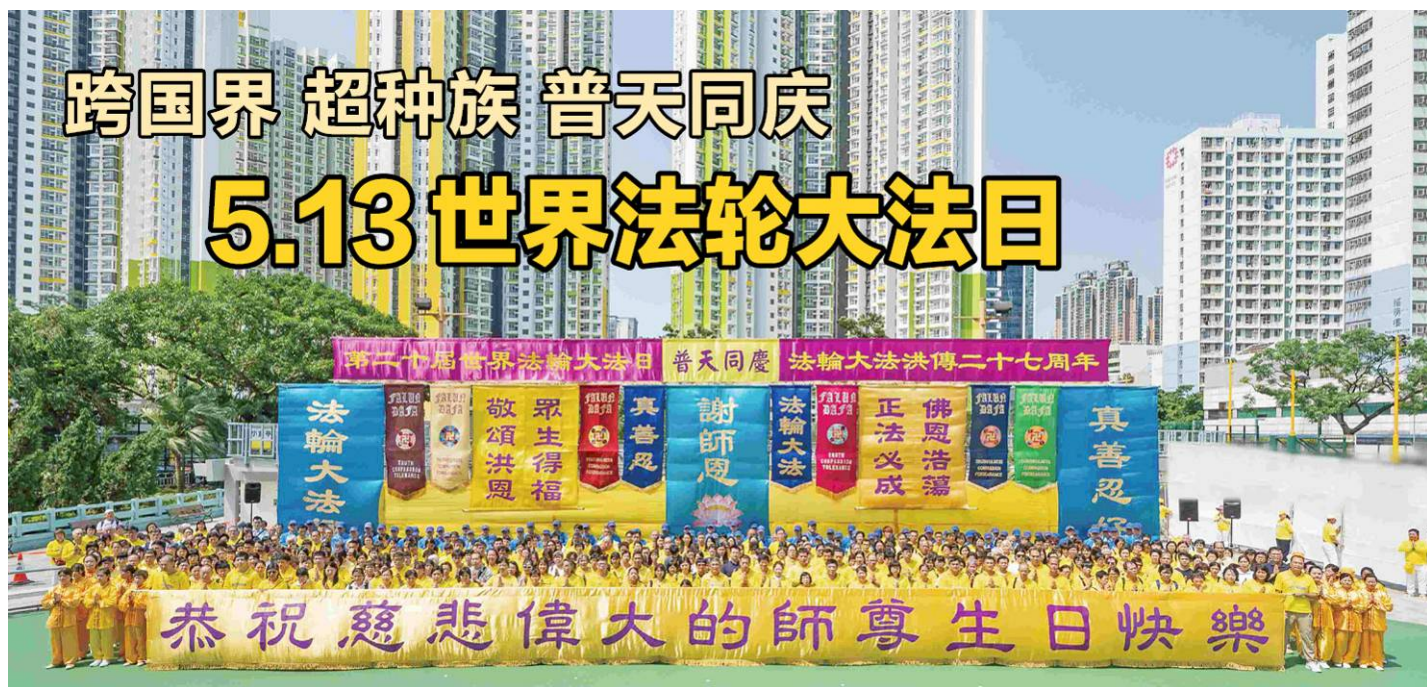
▲5月12日，香港法轮功学员举办盛大的集会游行，敬谢师恩，并向民众传扬“法轮大法好，真善忍好”的福音。