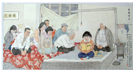
▲绘画：法轮功学员集体学法（一起读《转法轮》）。

回家刚两天，单位一个年轻男同事就来劝我炼法轮功。他给我介绍了法轮大法祛病健身方面的神奇效果，并讲了自己的亲身经历。一年前他因脑瘤做了开颅手术，术后大伤元气，头发稀疏，面黄肌瘦，走路气喘吁吁。后来炼法轮功时间不长，头发长出来了，体重增加，面色红润，浑身是劲。