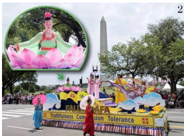
图2：法轮功学员的精美花

方人，年龄跨度从10多岁到80岁，他们来自社会不同阶层和行业，有医生、媒体记者、工程师、公司主管和学生等。