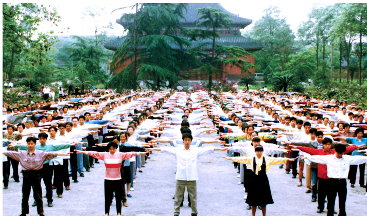
1999 年中共迫害前，四川成都一炼功点法轮功学员集体炼功