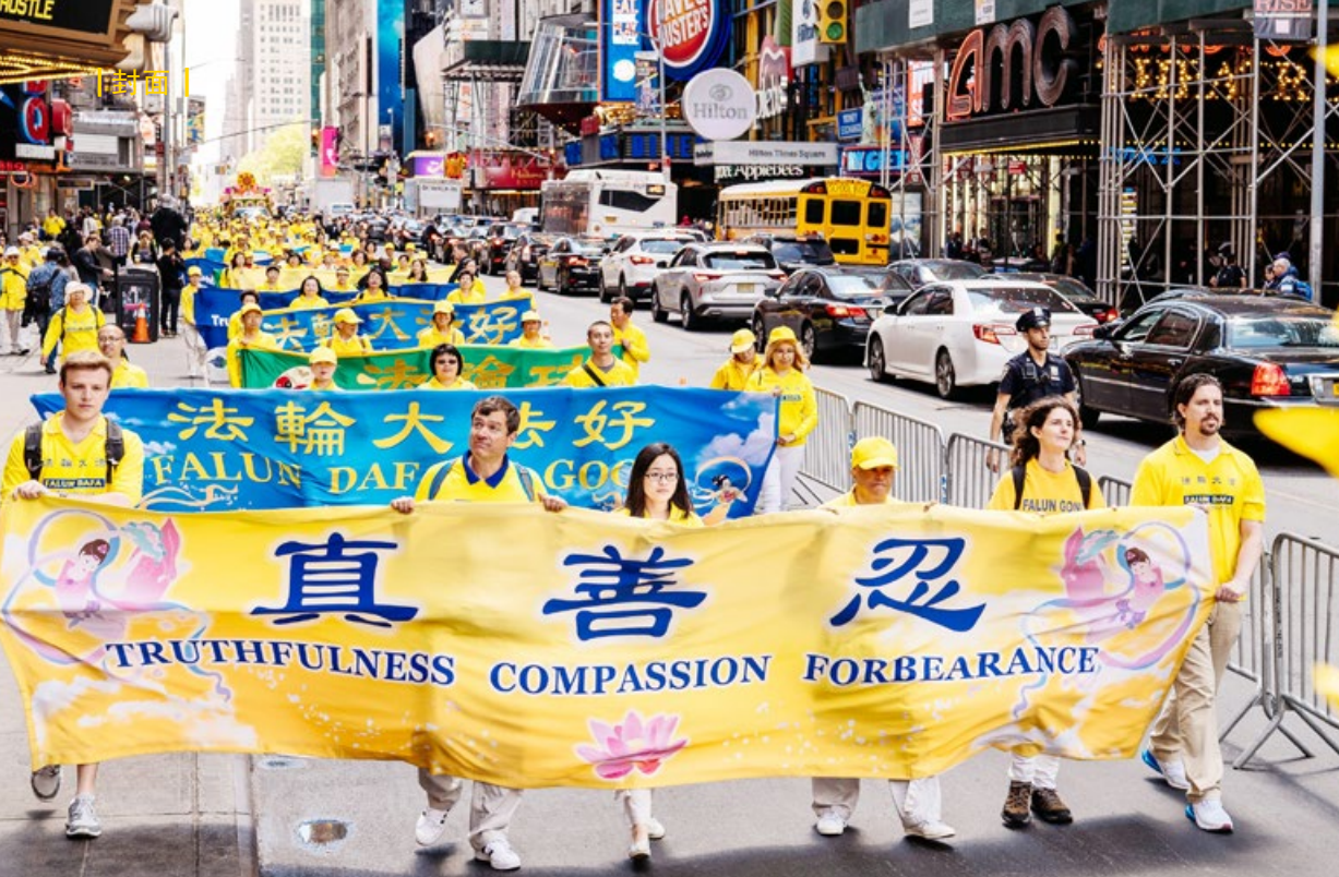
2019年5月16日,万名法轮功学员在纽约曼哈顿大游行,展现法轮大法的美好。