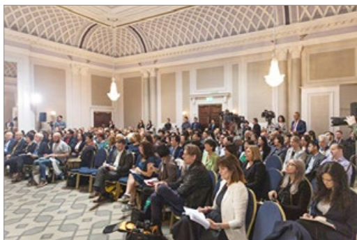
2019年6月17日，独立人民法庭在伦敦宣判，法庭内约有200名旁听民众和记者。

【明慧网】调查中共强摘器官的“独立人民法庭”（Independent people's tribunal）2019年6月17日在伦敦宣判，判定中共政府对以法轮功学员为主的良心犯进行大规模器官摘取，犯有“反人类罪”和“酷刑罪”。法庭认定，中共治下的政府是一个犯罪政权。