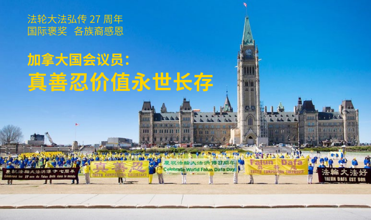
加拿大法轮功学员在首都渥太华国会山前庆祝法轮大法弘传 27 周年

2019 年 5 月 13 日是法轮大法传世 27 周年纪念日，也是第 20 届“世界法轮大法日”。加拿大多城市举行庆祝活动，政要纷纷褒奖法轮大法。