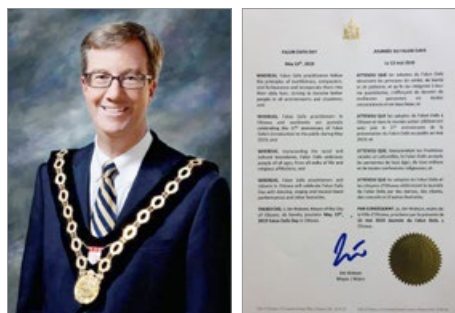
渥太华市长吉姆·沃森 (Jim Watson) 代表市议会宣布 2019 年 5 月 13 日为“渥太华法轮大法日”。右图为褒奖令。

褒奖状中感谢法轮大法创始人李洪志先生提升全世界上亿人的道德及健康水平，赞扬“真善忍”是普世价值，是每个人的榜样。