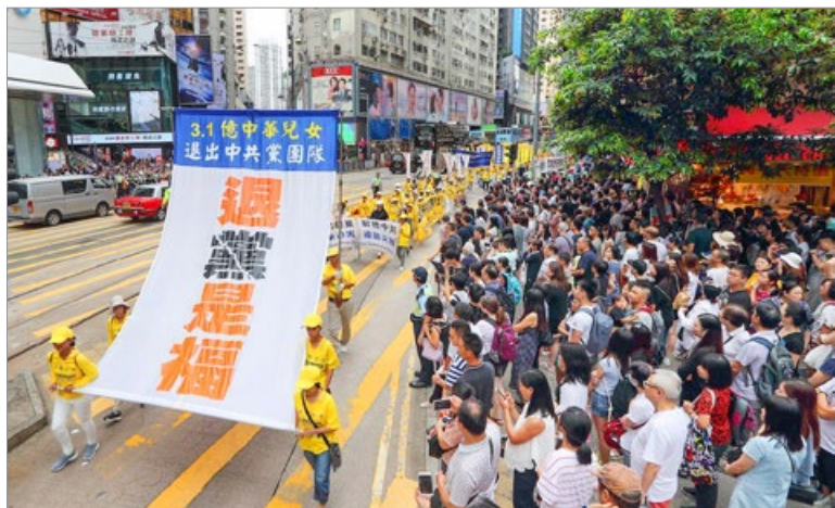
香港法轮功学员 2018 年 7 月 22 日大游行，祝贺 3 亿中国人三退（退党、退团、退队），选择光明的未来。至 2019 年 6 月，三退人数超过 3.3 亿。