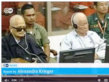
农谢（左）与乔森潘出庭受审

2018年11月，联合国资助的柬埔寨特别法庭以“种族灭绝罪”判处柬埔寨共产党头目——92岁的农谢与87岁的乔森潘（曾任国家主席）终身监禁。柬共残酷迫害异议者与宗教人士。