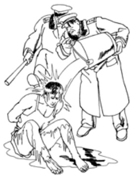
酷刑示意图：浇冰水

我被罚坐尖板凳共九天。第一天晚上，十多个犯人拿着水瓶子往我的脑袋上猛烈打击，身体被犯人群殴打得趴在地上，紧接着犯人用针到处乱扎我的前后身，并往我身上先浇凉水，后浇开水，我的双脚被烫破皮，犯人又用烟头烧我的脚面、脚趾。我的头部被打成一个坑，耳朵被打得出血，至今听不见声音，左侧第三根肋骨被打伤。