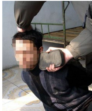
酷刑示意图：鞋底打脸

残酷的体罚和暴力殴打导致我的尾椎、后腰、臀部疼得直哆嗦，无法承受，肋骨疼得不敢喘气，下身浮肿，不能翻身。我被迫害得严重头晕，控制不了身体平衡，走路总要摔跟头，失去记忆，目光呆滞，什么也不知道，恶警说我是个傻子。