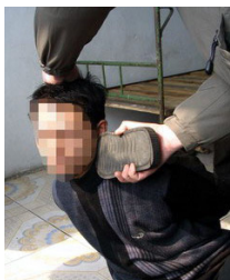
酷刑示意图：鞋底打脸

臀部疼得直哆嗦，无法承受，肋骨疼得不敢喘气，下身浮肿，不能翻身。我被迫害得严重头晕，控制不了身体平衡，走路总要摔跟头，失去记忆，目光呆滞，什么也不知道，恶警说我是个傻子。