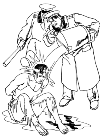
酷刑示意图：浇冰水

我被罚坐尖板凳共九天。第一天晚上，十多个犯人拿着水瓶子往我的脑袋上猛烈打击，身体被犯人群殴打得趴在地上，紧接着犯人用针到处乱扎我的前后身，并往我身上先浇凉水，后浇开水，我的双脚被