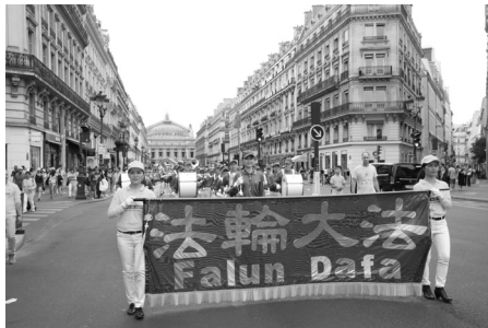
法国巴黎反迫害二十年集会游行

2019年7月20日是法轮功反迫害二十周年，20日前后，世界各地法轮功学员纷纷在当地举办集会、游行、烛光悼念和讲真相活动，各国政要、各界人士在集会上发言，或发来支持信，支持和声援法轮功和平理性反迫害，捍卫信仰自由。