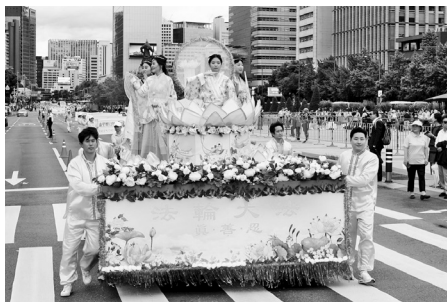
韩国首尔反迫害二十年游行