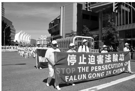
加拿大温哥华反迫害二十年集会游行