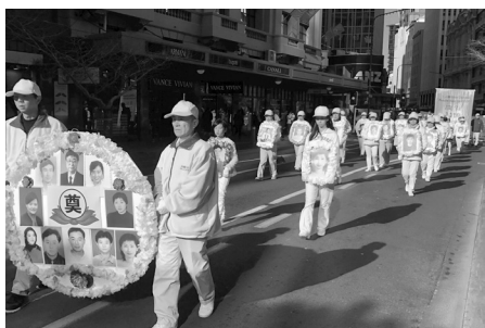
新西兰惠灵顿反迫害二十年游行