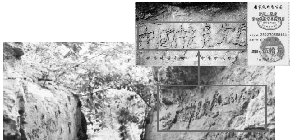
图为藏字石风景区和门票。

至2019年8月初，在海外退党网站声明退出中共党团队组织的人数已超过3.38亿。