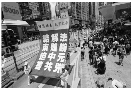
香港反迫害二十年集会游行