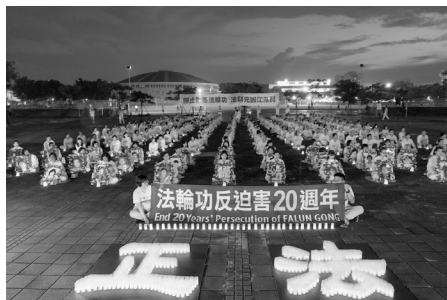
台湾高雄反迫害二十年烛光夜悼会