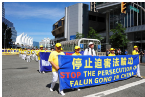
◀ 加拿大温哥华反迫害二十周年集会游行