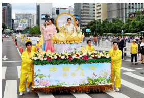
◀ 韩国首 尔反迫害二十 年游行