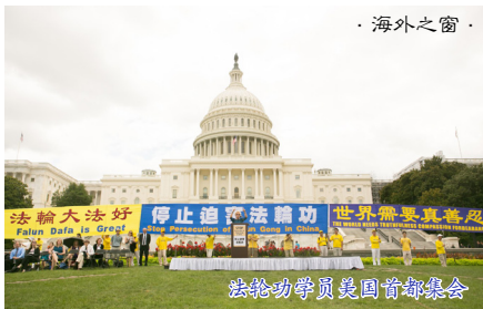
法轮功学员美国首都集会