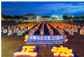
◀ 台湾高雄反迫害二十周年烛光夜悼会