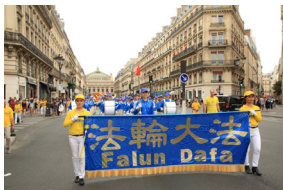
◀ 法国巴黎反迫害二十周年集会游行

2019年7月20日是法轮功反迫害二十周年，20日前后，世界各地法轮功学员纷纷在当地举办集会、游行、烛光悼念和讲真相活动，各国政要、各界人士在集会上发言，或发来支持信，支持和声援法轮功和平理性反迫害，捍卫信仰自由。