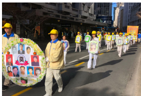
◀ 新西兰 惠灵顿反迫害 二十年游行