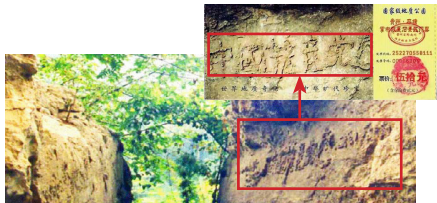
图为藏字石风景区和门票。

至 2019 年 8 月初，在海外退党网站声明退出中共党团队组织的人数已超过 3.38 亿。