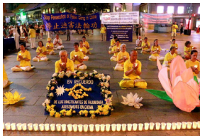
◀ 西班牙 反迫害二十年 烛光夜悼会