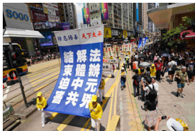
◀ 香港反 迫害二十年集 会游行