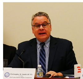
▲美国重量级议员 克里斯·史密斯

2019年7月25日，美国重量级联邦议员、众议院外交委员会全球人权小组委员会主席、国会兰托斯委员会共同主席、美国国会及行政当局中国委员会（CECC）前主席克里斯·史密斯说：“中共迫害法轮功犯下反人类罪，支持川普政府制裁迫害法轮功的中共官员。”