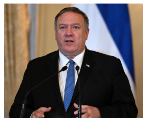
▲美国国务卿蓬佩奥

2019年7月16日至18日，第二届全球宗教自由部长级会议在美国首都华盛顿举行，美国国务卿蓬佩奥指出，“中国正发生着这个时代最恶劣的人权侵犯行为，是本世纪的污点！”“中国共产党不仅控制中国人的肉体，还要控制他们的灵魂。”