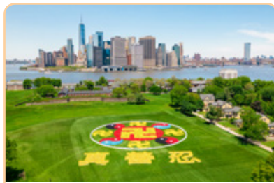
◎ 2019年5月，5千名法轮功学员在纽约总督岛排出“真善忍”三个大字和法轮图形，庆祝法轮功弘传27周年。

菁华把婆婆当作至爱的亲人，耐心照顾她，真诚呵护她。婆婆高兴得合不拢嘴，常常当着儿女的面说：“儿媳妇好，比姑娘还好！”