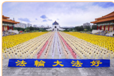
◎ 法轮功受到台湾各界人士欢迎，有 50 多万人走入修炼，1 千多个炼功点遍布城市乡镇。

每天清晨 4 点多，在振兴医院前方开阔的青草地上，可以看到一群炼功人，其中一位就是骨科部主任敖曼冠。不论晴雨寒暑，20 多年来他几乎从未间断。