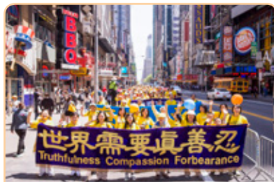
◎ 8000 多名法轮功学员举行盛大庆典游行，把法轮大法的美好传递给纽约曼哈顿的民众。

旁边的人一看警察都来要法轮功资料，就都围上来要资料，做“三退”（退出中共党、团、队）。丽琴见这么多人要了解真相，很感动，帮他们都做了“三退”，祝福他们选择了美好未来。现在想要了解法轮功真相的人越来越多了。