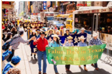
◎ 来自世界各地的上万名法轮功学员在纽约举行盛大游行，横贯曼哈顿市中心。图为行人与法轮功学员击掌鼓励。