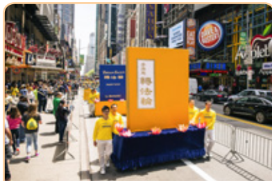
◎ 纽约盛大游行中，《转法轮》一书模型高大醒目。在中共发动迫害之前，《转法轮》多次荣登北京市畅销书榜单。

《转法轮》一书，阐述了健康与道德的关系，修炼者按照“真善忍”的标准要求自己，就能获得身体净化。在世界各地，出现了许多绝处逢生的奇迹。