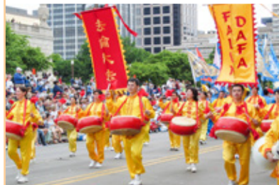
◎ 30万观众观看美国著名的“印第500大游行”，法轮功是唯一受邀参加游行的亚洲队伍。