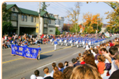
◎ 加拿大滑铁卢市感恩节大游行，法轮功学员组成的天国乐团、腰鼓队等方阵受到沿途 30 多万观众的欢迎。

20 多年来，严成碧远离病痛，无病一身轻。她先生和女儿都是医学专家，目睹她身体的变化，对法轮功赞叹不已；亲友和周围的医学界同仁们，也都对法轮大法啧啧称奇。8 年前，严成碧来到海外与孩子团聚，享受天伦之乐。