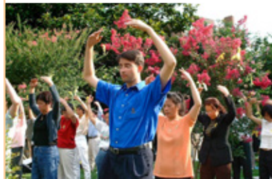
◎ 四海同心——华盛顿法轮功学员举行集体炼功活动，声援被中共迫害的大陆法轮功学员。