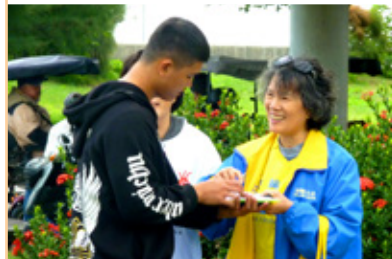
◎ 台湾法轮功学员给大陆游客讲真相。在世界很多著名景点，法轮功学员讲真相的身影到处可见。