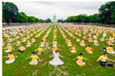
◎ 迄今，法轮功弘传世界100多个国家，许多西方人激动地说：法轮大法属于全世界，世界需要“真善忍”。