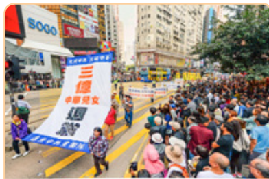
◎ 香港法轮功学员及市民在市区中心举行盛大游行，庆祝大陆民众退出中共党、团、队组织。