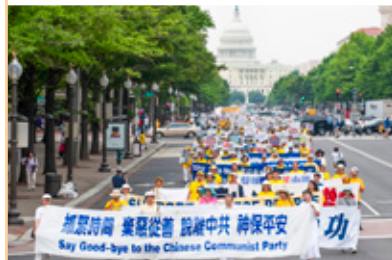
◎ 法轮功学员游行队伍穿越美国华盛顿主要大道，告诉人们赶快退出中共，选择美好未来。