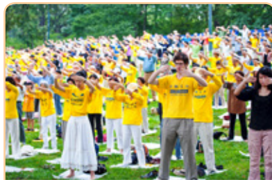
◎ 北美洲有众多不同族裔的人修炼法轮功，美国50个州中有40多个州有法轮功炼功点。

他的心愿是，让更多的民众能了解法轮大法的美好，了解中共迫害法轮功的残酷，同时希望大家都能分清善恶，不被中共吓倒，更不要被它迷惑。