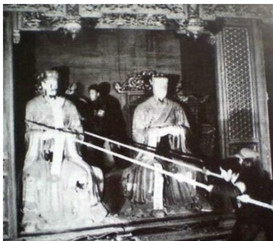
▲ 中共“破四旧”时损毁了许多古建筑