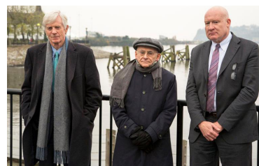
▲（左起）《血腥的器官摘取 / 大屠杀：更新版》的三位作者大卫·乔高、大卫·麦塔斯和伊森·葛特曼合影。

2016年6月22日，加拿大前亚太国务卿大卫·乔高（David Kilgour）、美国资深调查记者伊森·葛特曼（Ethan Gutmann）和加拿大人权律师大卫·麦塔斯（David Matas），在美国联合发布中共强摘人体器官的最新调查报告。报告披露，中共官方一直宣称每年器官移植约一万例，但最新调查报告表明，仅仅几家医院的年移植量就已超过该数字。2007年向中共卫生部申请许可的移植机构有上千家，其中仅146家获准移植机构自2000年以来的满床位肝肾移植总量就达百万量级。因此，整个中国器官移植总量惊人。这些器官的主要来源是法轮功学员。