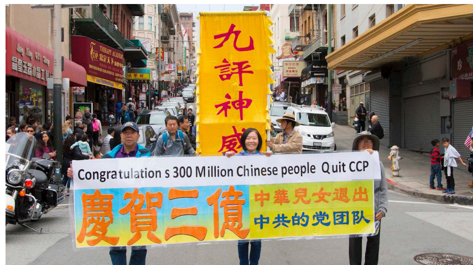
▲ 美国北加州退党服务中心旧金山游行，庆祝三亿中国人三退。