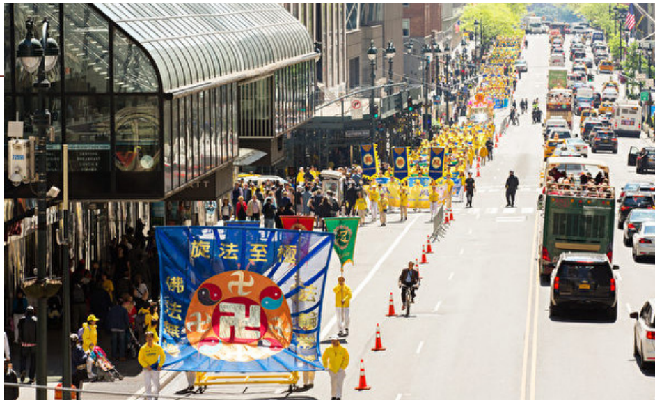
▲ 2019年5月，万名法轮功学员美国纽约游行庆祝法轮大法弘传27周年。

殷洪发誓说：“弟子若有他意，四肢俱成飞灰。”殷郊发誓说：“弟子如改前言，当受犁锄之厄。”后来他们先后违背誓约，殷洪误入太极图肉身化为灰烬而亡；殷郊被夹在两座山中间受犁锄而死。《封神演义》中还提到申公豹向元始天尊发誓：如果他继续违背天意助纣为虐，就要以身塞北