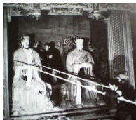
▲中共“破四旧”时损毁了许多古建筑