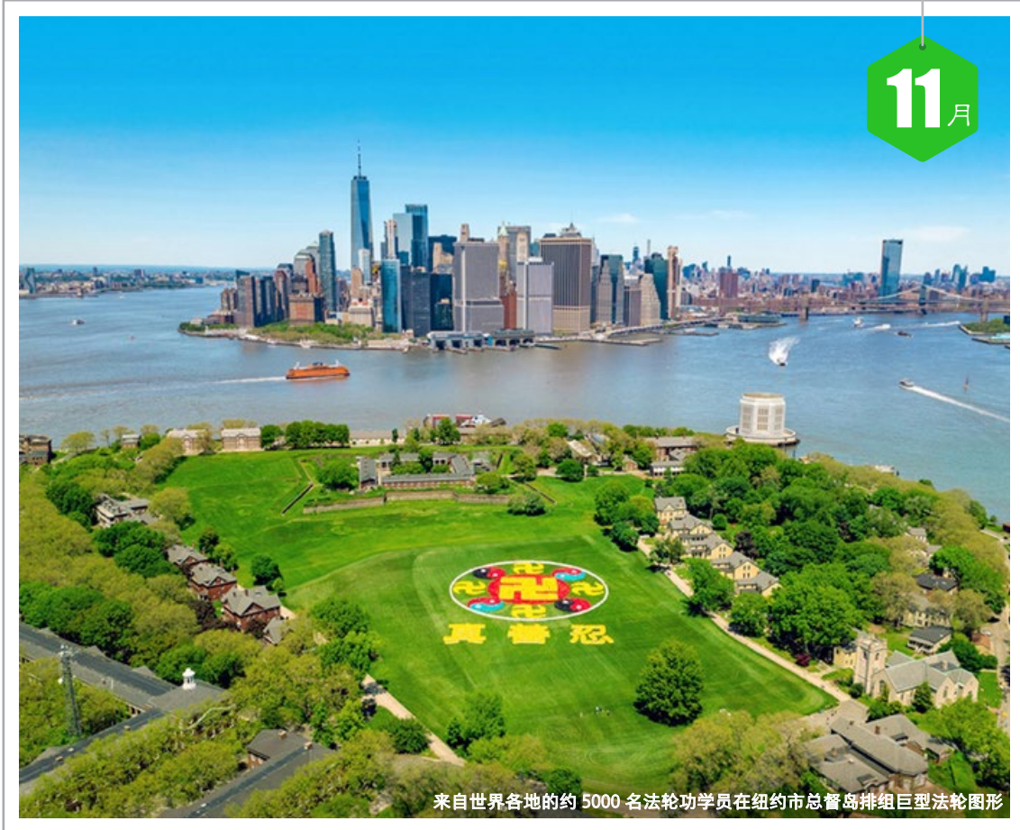
来自世界各地的约 5000 名法轮功学员在纽约市总督岛排组巨型法轮图形

日 1 十六 一 2 十七 二 3 十八 三 4 十九 四 5 二十 五 6 廿一 六 7 立冬 日 8 廿三 一 9 廿四 二 10 廿五 三 11 廿六 四 12 廿七 五 13 廿八 六 14 廿九 日 15 十月大 一 16 初二