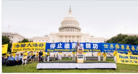
每年的 7 月，法轮功学员都在美国首都华盛顿国会山前举行反迫害活动，多位政要到场声援。