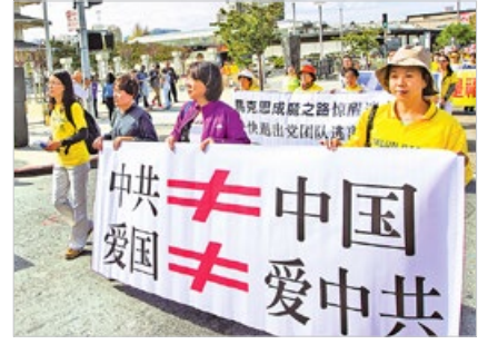
海外法轮功学员传真相：中国不是中共，爱国不是爱党。已有3亿多中国人声明退出党团队。