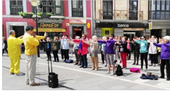
西班牙媒体《Nueva Alcarria》报道：“中国是全世界唯一不让炼法轮功的国家。”图为西班牙阿斯图利亚省首府民众学炼法轮功。