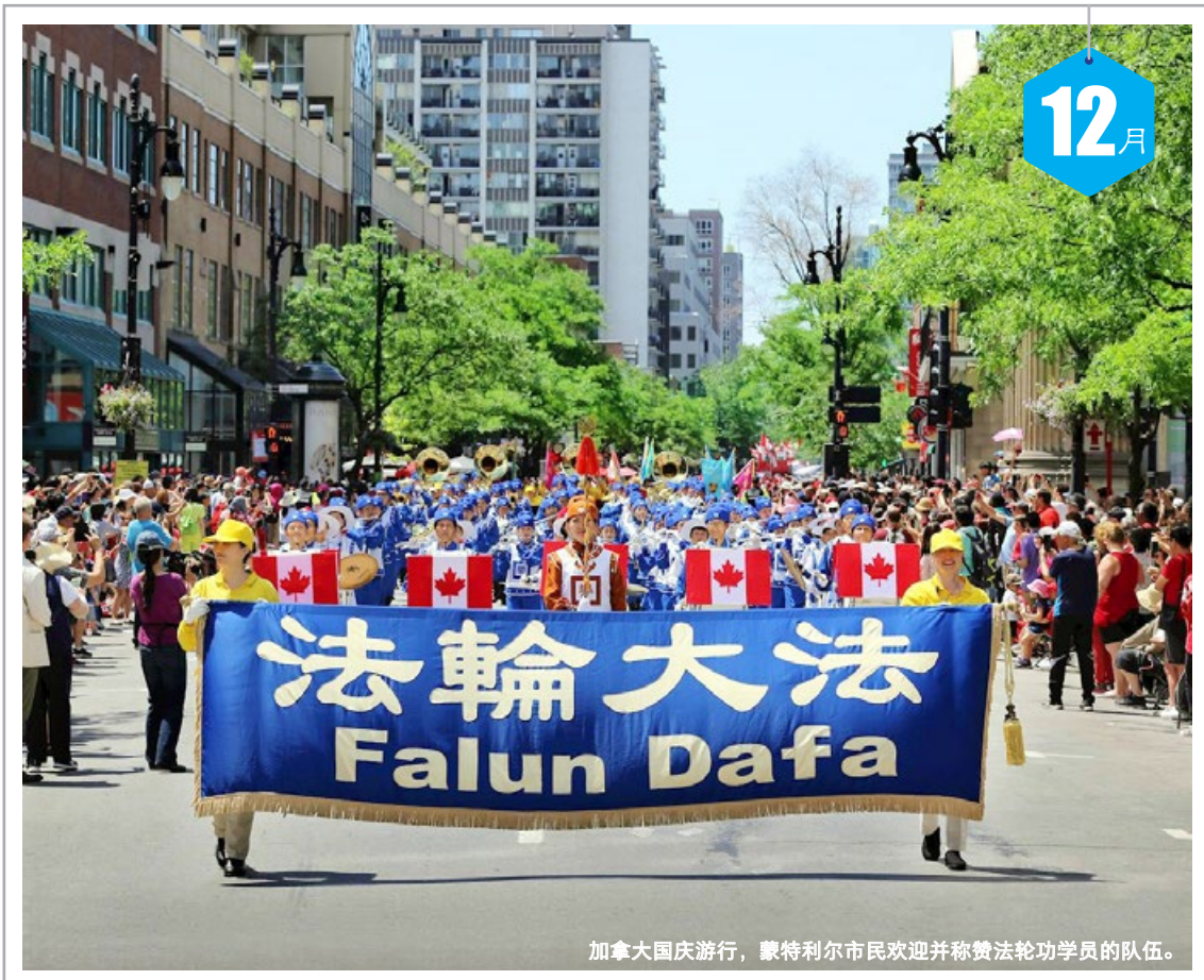
加拿大国庆游行，蒙特利尔市民欢迎并称赞法轮功学员的队伍。

二 1 十七 三 2 十八 四 3 十九 五 4 二十 六 5 廿一 日 6 廿二 一 7 大雪 二 8 廿四 三 9 廿五 四 10 廿六 五 11 廿七 六 12 廿八 日 13 廿九 一 14 三十 二 15 十一 三 16 初二