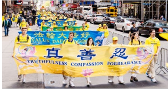
不同族裔的法轮功学员 2019年5月16日在纽约大游行，传播“法轮大法好”和中共迫害法轮功的真相。