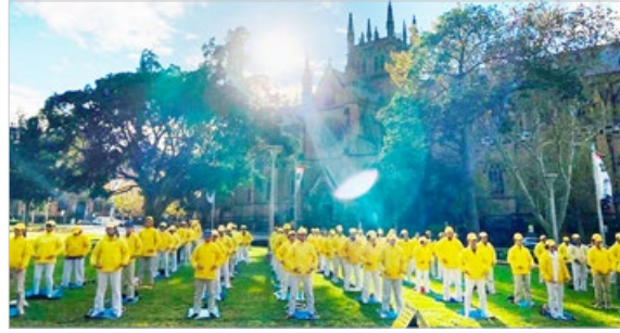
2019年5月11日清晨，悉尼市中心的海德公园里，法轮功学员集体炼功，祥和的能量场和美妙的炼功音乐，吸引人驻足。