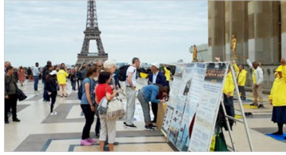
法国巴黎市民和游客阅读法轮功真相展板，人们签名支持法轮功，华人游客声明“三退”。