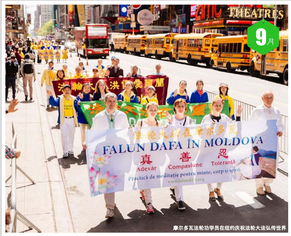
摩尔多瓦法轮功学员在纽约庆祝法轮大法弘传世界

二 1 十四 三 2 十五 四 3 十六 五 4 十七 六 5 十八 日 6 十九 一 7 白露 二 8 廿一 三 9 廿二 四 10 廿三 五 11 廿四 六 12 廿五 日 13 廿六 一 14 廿七 二 15 廿八 三 16 廿九