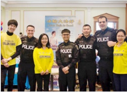
加拿大多伦多法轮功学员在 2019 年 4 月参加约克区警察局举办的反种族歧视活动，介绍法轮大法。