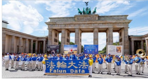
德国法轮功学员 2019 年 8 月 10 日在柏林举行反迫害大游行，民众前来了解真相，签名呼吁制止中共迫害法轮功。