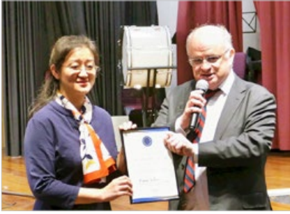
澳洲悉尼帕拉马塔市长威尔逊（右）2019年5月颁发褒奖令，赞扬法轮大法带给人无限的正向能量。