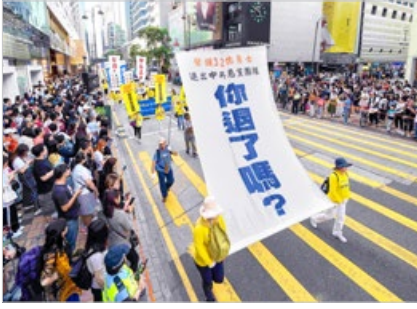
香港法轮功学员于2019年5月12日游行传播真相，场面理性祥和，大陆游客震撼。