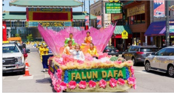
2019年8月3日，美国芝加哥法轮功学员大游行传真相，精美的花车上，不同族裔的法轮功学员展现修炼“真善忍”的美好。