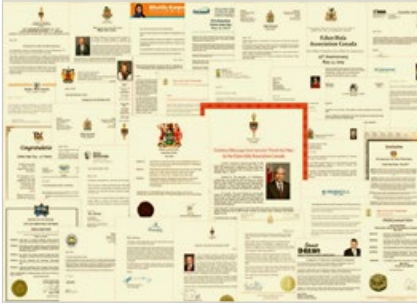
法轮大法福益社会，已经弘传世界100多个国家和地区，获国际褒奖、支持议案和支持信函3600多份。