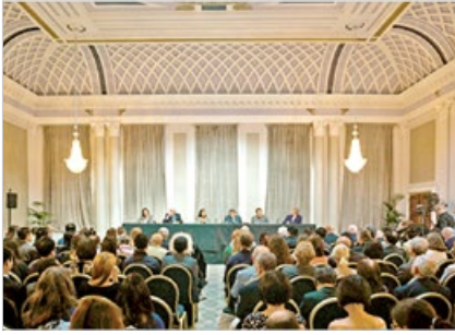
英国独立人民法庭 2019年6月17日宣判：中共活摘法轮功学员器官。法庭认定中共是犯罪政权。