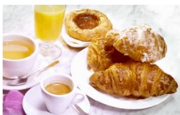
天梯书店的优质咖啡和特色茶点