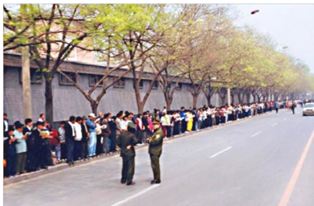
1999年4月25日上访现场秩序井然，警察不用维持秩序。

有人认为：法轮功学员上访，导致中共迫害。其实不然。江泽民在1996年就预谋迫害法轮功，不断制造事端：① 1996年非法禁止出版法轮功书籍。② 江泽民、罗干一伙扣压国务院总理对法轮功的正面批示。③ 1998年公安部派人四处收集法轮功的“罪证”，结果是：未发现问题。之后却让公安强行驱散