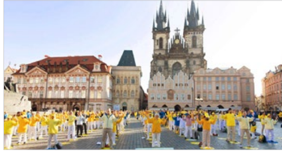
来自欧洲的法轮功学员在捷克首都布拉格集体炼功，游客了解法轮功真相后，纷纷赞颂“真善忍”并签名希望早日结束迫害。