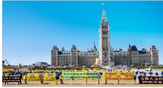
加拿大法轮功学员 2019 年 5 月在首都渥太华国会山前庆祝法轮大法弘传世界 27 周年，多位国会议员到场支持。