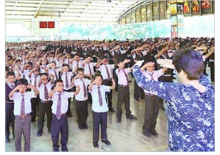
印度骄狄英语中学师生都修炼法轮功，全校600多名师生2019年6月18日集体炼功。