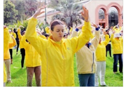
索菲亚参加法轮功学员的集体晨炼，她说现在对电子游戏一点兴趣都没有了，感谢师父。