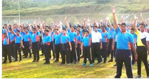
马来西亚霹靂州巴力玛拉理科初级学院的学生在炼法轮功，学生说：学法轮大法，能让我们的道德和行为变得更好。