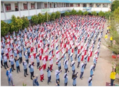
印尼巴丹岛第38国立中学的操场上，约500名师生于2019年2月16日集体炼法轮功。