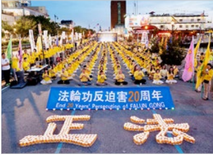
自由亚洲电台 2019 年 8 月播出《法轮功的 20 年》，报道法轮功反迫害 20 年来，弘传世界。图为纽约。