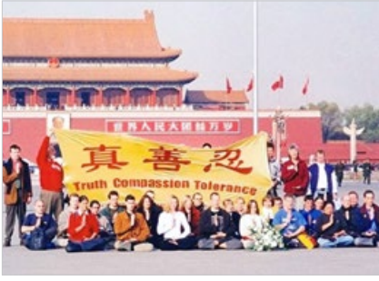
历史图片：2001年11月20日，36名西人法轮功学员在天安门广场展开“真善忍”横幅。