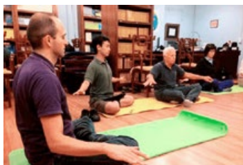
天梯书店的法轮大法免费教功班