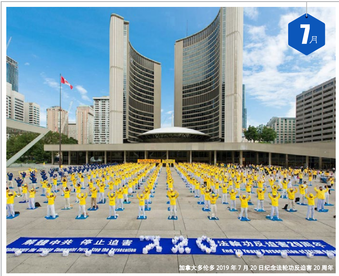
加拿大多伦多 2019 年 7 月 20 日纪念法轮功反迫害 20 周年

三 1 十一 四 2 十二 五 3 十三 六 4 十四 日 5 十五 一 6 小暑 二 7 十七 三 8 十八 四 9 十九 五 10 二十 六 11 廿一 日 12 廿二 一 13 廿三 二 14 廿四 三 15 廿五 四 16 初伏