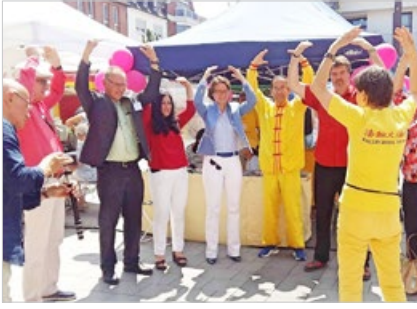
德国绿嫩市官方网站向市民推荐法轮功，联邦议员和北威州国土资源部长正在体验法轮功。