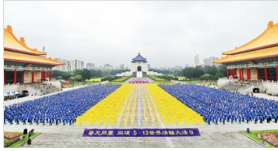
7000多名法轮功学员在台北自由广场举行排字、炼功等活动，庆祝“5·13世界法轮大法日”。