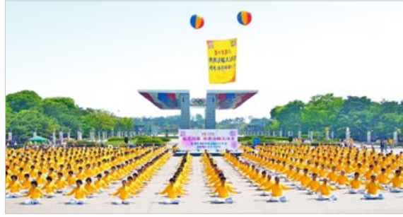
韩国法轮功学员在首尔奥林匹克公园炼功。法轮功“真善忍”使人道德回升，身体健康，在亚洲，法轮功修炼者遍布 30 多国。