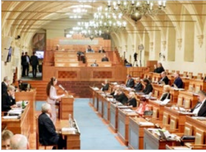
捷克参议院 2019 年 3 月 20 日通过 131 号决议案，要求中共停止迫害法轮功，释放良心犯。