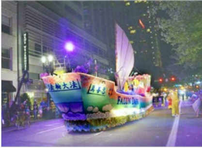
法轮功团体于 2019 年 6 月 1 日参加美国俄勒冈州波特兰星光游行，获第一名。