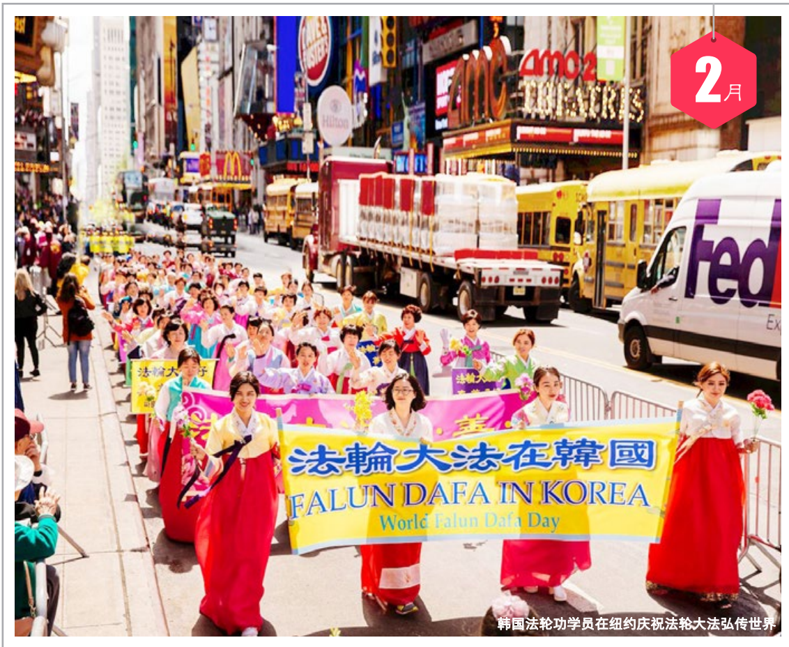
韩国法轮功学员在纽约庆祝法轮大法弘传世界

六 1 初八 日 2 初九 一 3 初十 二 4 立春 三 5 六九 四 6 十三 五 7 十四 六 8 元宵节 日 9 十六 一 10 十七 二 11 十八 三 12 十九 四 13 二十 五 14 七九 六 15 廿二 日 16 廿三