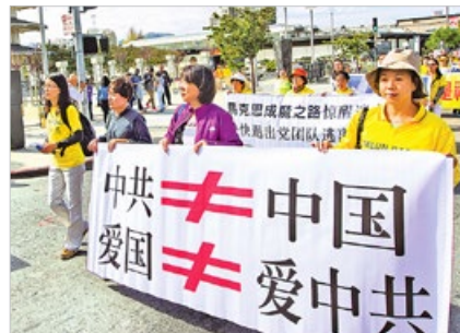
海外法轮功学员传真相：中国不是中共，爱国不是爱党。已有3亿多中国人声明退出党团队。