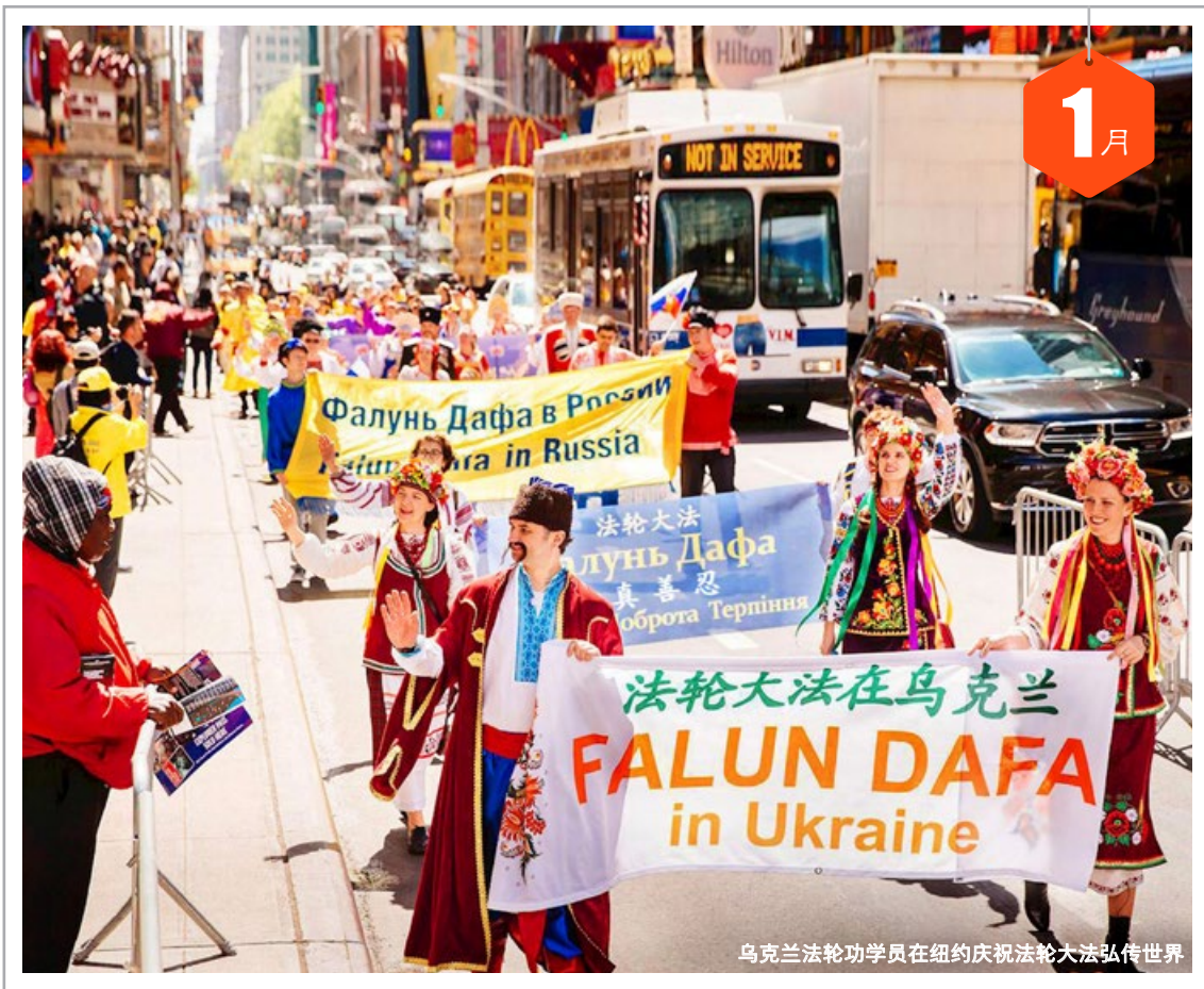
乌克兰法轮功学员在纽约庆祝法轮大法弘传世界

三 1 元旦 四 2 腊八节 五 3 初九 六 4 初十 日 5 十一 一 6 小寒 二 7 十三 三 8 十四 四 9 三九 五 10 十六 六 11 十七 日 12 十八 一 13 十九 二 14 二十 三 15 廿一 四 16 廿二