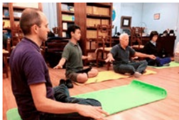
天梯书店的法轮大法免费教功班