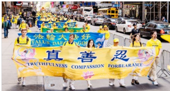
不同族裔的法轮功学员 2019年5月16日在纽约大游行，传播“法轮大法好”和中共迫害法轮功的真相。