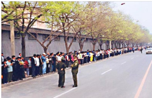
1999年4月25日上访现场秩序井然，警察不用维持秩序。

万人和平上访，是法轮功学员在中共迫害升级的情况下，不得已采取的合法的反迫害举措，无关政治。