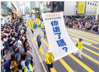
香港法轮功学员于2019年5月12日游行传播真相，场面理性祥和，大陆游客震撼。