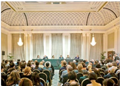
英国独立人民法庭 2019年6月17日宣判：中共活摘法轮功学员器官。法庭认定中共是犯罪政权。