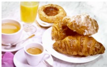
天梯书店的优质咖啡和特色茶点