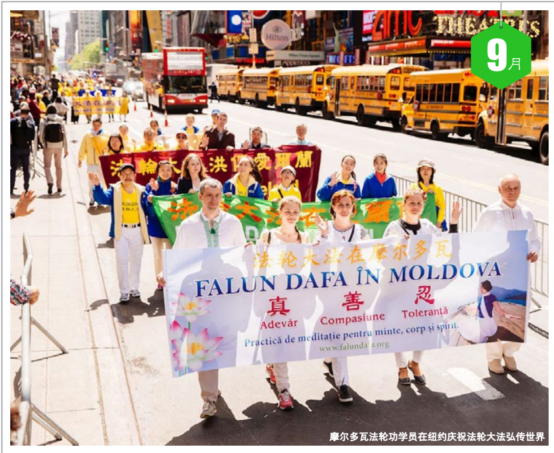
摩尔多瓦法轮功学员在纽约庆祝法轮大法弘传世界

二 1 十四 三 2 十五 四 3 十六 五 4 十七 六 5 十八 日 6 十九 一 7 白露 二 8 廿一 三 9 廿二 四 10 廿三 五 11 廿四 六 12 廿五 日 13 廿六 一 14 廿七 二 15 廿八 三 16 廿九