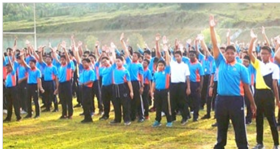
马来西亚霹靂州巴力玛拉理科初级学院的学生在炼法轮功，学生说：学法轮大法，能让我们的道德和行为变得更好。