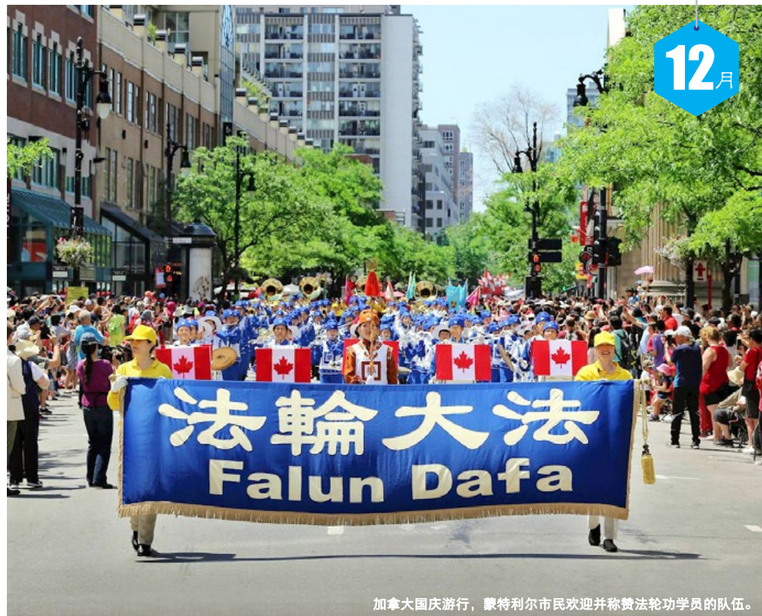
加拿大国庆游行，蒙特利尔市民欢迎并称赞法轮功学员的队伍。

二 1 十七 三 2 十八 四 3 十九 五 4 二十 六 5 廿一 日 6 廿二 一 7 大雪 二 8 廿四 三 9 廿五 四 10 廿六 五 11 廿七 六 12 廿八 日 13 廿九 一 14 三十 二 15 十一 三 16 初二