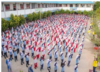
印尼巴丹岛第38国立中学的操场上，约500名师生于2019年2月16日集体炼法轮功。