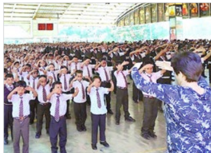
印度骄狄英语中学师生都修炼法轮功，全校600多名师生2019年6月18日集体炼功。