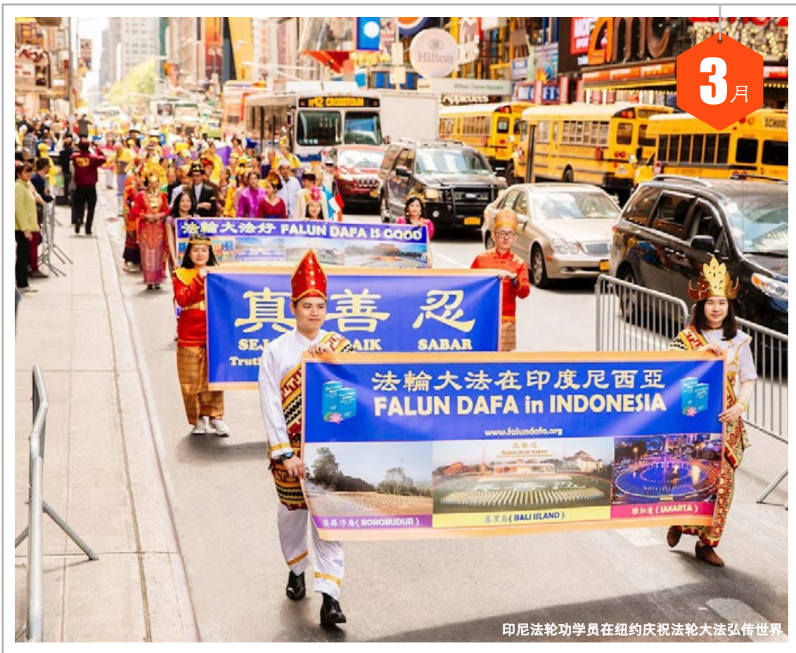
印尼法輪功學員在紐約慶祝法輪大法弘傳世界

日 1 初八 一 2 初九 二 3 九九 三 4 十一 四 5 惊蛰 五 6 十三 六 7 十四 日 8 十五 一 9 十六 二 10 十七 三 11 十八 四 12 十九 五 13 二十 六 14 廿一 日 15 廿二 一 16 廿三