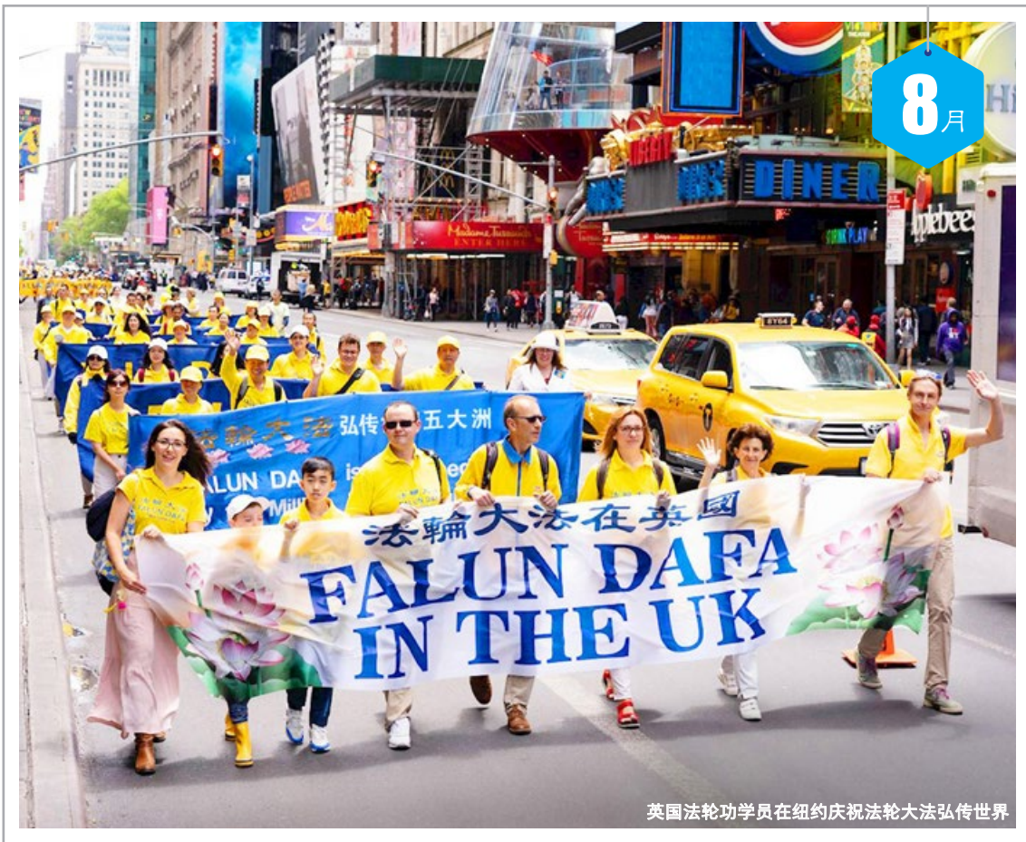
英国法轮功学员在纽约庆祝法轮大法弘传世界

六 1 十二 日 2 十三 一 3 十四 二 4 十五 三 5 十六 四 6 十七 五 7 立秋 六 8 十九 日 9 二十 一 10 廿一 二 11 廿二 三 12 廿三 四 13 廿四 五 14 廿五 六 15 未伏 日 16 廿七