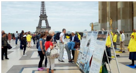
法国巴黎市民和游客阅读法轮功真相展板，人们签名支持法轮功，华人游客声明“三退”。