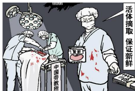
时事漫画：罪恶的交易