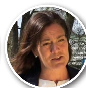
瑞典国会议员 阿尔梅