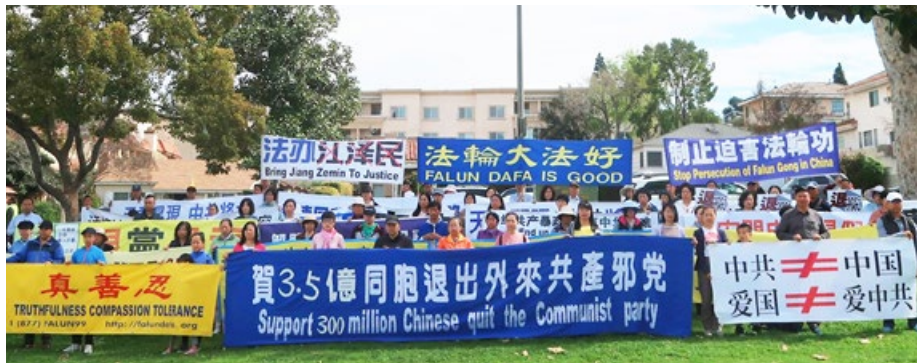
▲ 2020年2月29日，美国洛杉矶法轮功学员举行集会。