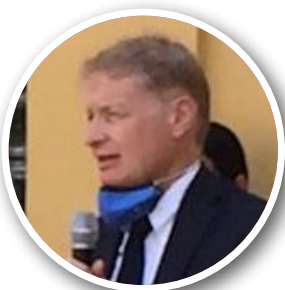
意大利力量党参议员卢齐奥·马兰