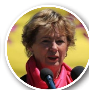
加拿大自由党 国会议员朱迪· 思格若