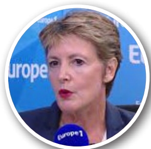
法国国会议员弗雷德里克·杜马斯

美国国务卿蓬佩奥（上图）：7 月 20 日，美国国务卿蓬佩奥发表声明，要求中共立即停止对法轮功学员的虐待，对法轮功学员 21 年的迫害已经太长太久，必须停止。