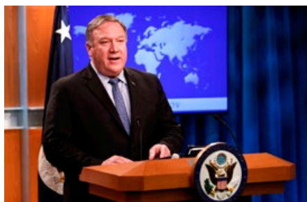
美国国务卿蓬佩奥在声明中，要求中共政权立即停止对法轮功的迫害。

他认为，法轮功 21 年的坚持抗争，为香港人提供很多经验和启发，“我相信更多更多的香港市民，可以跟法轮功