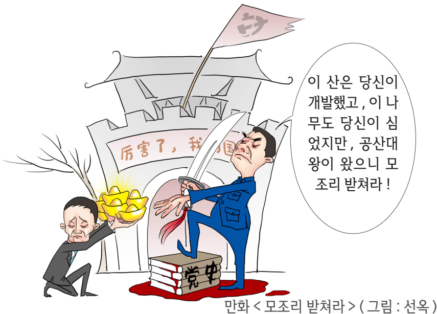
만화 <모조리 받쳐라> (그림: 선옥)

2021년 4월 15일, “미중 경제안전 심사위원회”는 공청회를 열었다. 전미국 국무부 장관 폼페이오 수석 중국정책 기획 고문은 마윈(马云)이 벌금받은 사건을 제기하면서 미국에서는 사람들이 억만부자명단에 오른 사람에게 박수를 쳐주지만, 중국에서 억만 부자는 곧 정권자에 의해 타격의 명단에 오를 수 있다고 말했다.