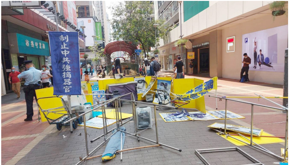
2021년 4월 2일, 악당 4명이 홍콩 파룬궁진상거점을 파괴했다. 악당들은 기발을 찢고, 칼로 전시판을 망가뜨렸으며, 흑먹을 뿌렸다.

그는 또 악은 정의를 이길 수 없다. 기독교는 고대 로마에서 300년 동안 박해를 받았지만 기독교는 굴복하지 않았고 결국 로마의 국교가 됐다.