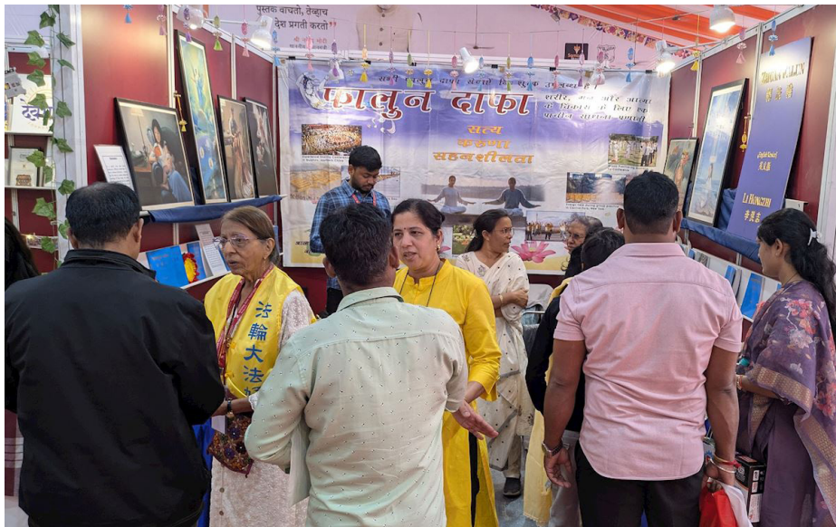
图：印度法轮功学员参加由印度教育部下属国家图书信托基金会（NBT）主办的浦那书展（Pune Book Festival），展示了大法著作《转法轮》和《法轮功》。