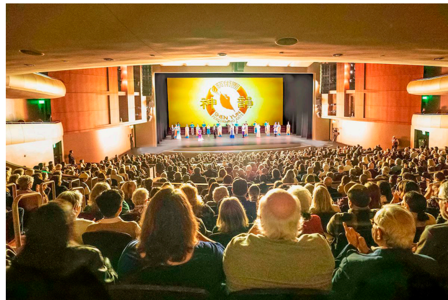
图：二零二六年一月十日下午，神韵北美艺术团在美国加州莫德斯托市加洛艺术中心的玛丽斯图尔特罗杰斯剧院（Gallo Center for the Arts Mary Stuart Rogers Theater）的第二场演出爆满。