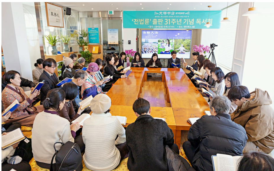
图：韩国首尔天梯书店二零二六年一月四日举办了纪念《转法轮》出版三十一周年纪念活动，五十余名学员齐声朗读《转法轮》，并分享了自己修炼后人生发生的变化。