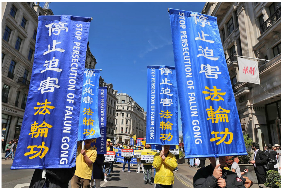
图：为纪念万名法轮功学员北京和平上访二十七周年，英国部份法轮功学员四月二十五日在伦敦市中心举行游行及新闻发布会，呼吁国际社会制止中共长达二十多年的残酷迫害。