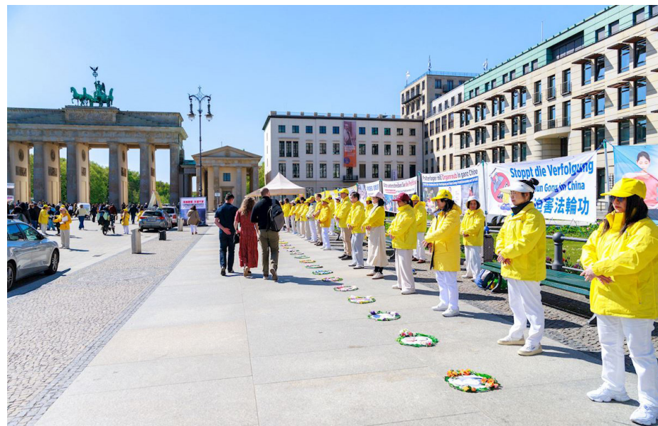
图：为纪念四·二五和平上访二十七周年，二零二六年四月二十五日，部份柏林法轮功学员在著名地标勃兰登堡门举办纪念活动。