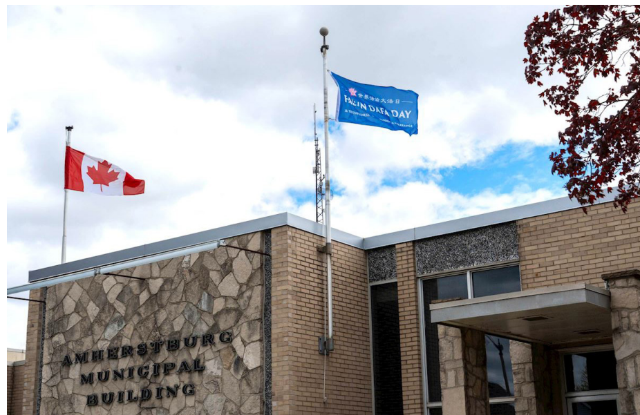
图：“庆祝法轮大法日”旗帜在加拿大阿默斯特堡市升起。