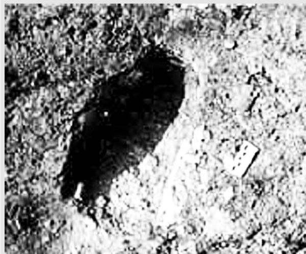
图：意大利南部发现的30萬年前的人類足跡

古老人类化石的不断发现使得很多科学家开始怀疑进化论的正确性。史前文明的存在证据正在越来越多地展现出来。 ◇同云