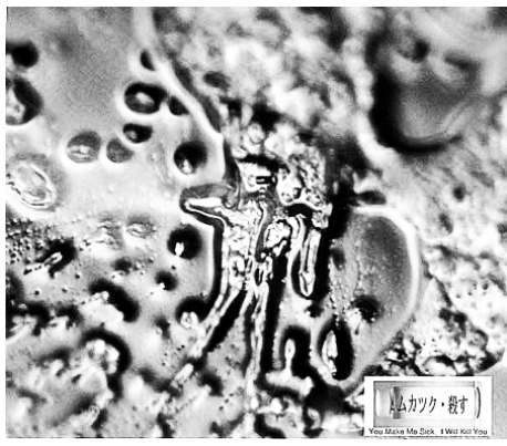
右图：让水读了“真恶心讨厌，我要杀了你”所拍的照片。

圖：日本的IHM研究所的江本勝彈31561 脹人自1994年起在冷房中以高速攝影的技術觀察水的結晶。