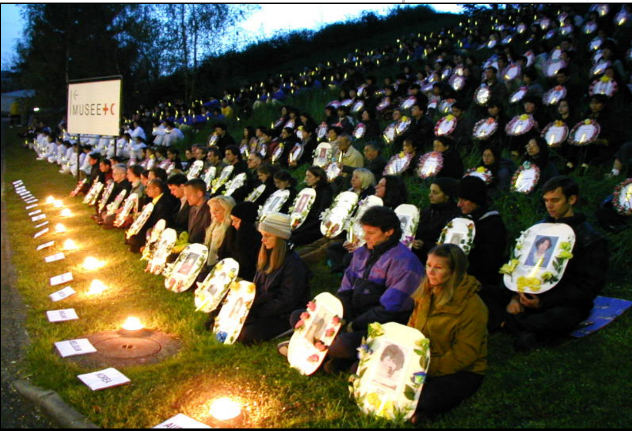
4月17日联合国投票前夕内瓦法轮功全球性烛光守夜悼念被迫害致死学员