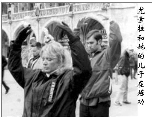
尤素拉和她的儿子在炼功