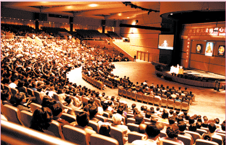
澳大利亞法輪大法心得交流會，1999年5月，悉尼

美東時間1999年11月18日，美國眾議院全體通過了批評中國政府違反國際基本人權的決議案。11月19日星期五下午，美國參議院也通過了有關決議案。兩項決議案均旨在要求中國政府遵守自己簽署的國際人權公約，停止對法輪功學員的逮捕、關押和迫害，釋放因信仰不同而被關