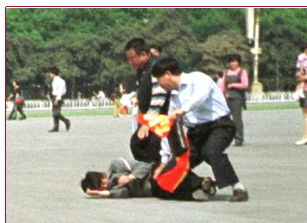
中國政府僱傭地痞流氓對法輪大法學員進行殘酷迫害。2000年6月25日，北京天安門廣場

★ 99年9月8日，在北京昌平收容所，為保護《轉法輪》一書不被公安人員搶走，8名學員輪番撲倒在書上，20名公安人員用警棍、手拷逐一將他們殘酷拷打。有的頭部、胸部被打傷，有的手腕被卡得鮮血淋漓。這場拷打從上午持續到下午，8名學員打不還手，罵不還口。周圍的犯人都感動得哭了，公安人員打得汗流浹背，氣喘吁吁。最後，他們被8名學員的行為所感動，有的眼含着熱淚豎起大拇指說：你們是不要命的好人！書，你們看吧，我們不要了。