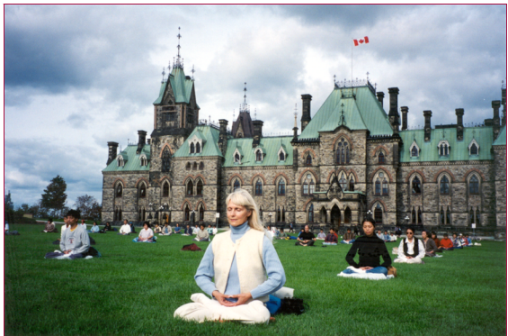
加拿大學員在國會大樓前草坪上煉功，敦促加拿大政府對中國鎮壓法輪功予以關注。

的信息反饋。我們不相信中華人民共和國竟會對這些無辜的生命置之不理，但擺在我們面前