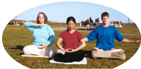
Wallis 海灘公園煉功，2000年 4月1日，美國新罕布什州