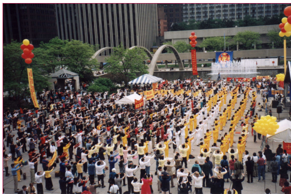
加拿大慶祝法輪大法弘傳7周年，圖為在 多倫多城市廣場的慶典。1999年5月22日