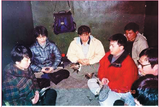
因履行公民上訪權利上訪被捕的法輪大法學員被拘留于北京郊區的一拘留所。在極其惡劣的環境下，他們仍然堅持集體煉功。2000年3月，中國北京。

在此之前犯人們大部份沒有聽說過法輪大法，我進去之前她們都根據輿論宣傳的導向寫的認識，我進去後她們看到我是一個實實在在的好人，我還不斷向她們介紹修煉的真實情況，她們由開始的好奇到逐漸地瞭解，發現電視宣傳都是假的，竟有一半多人表示想修煉大法，很多人跟我學打坐，我也覺得有意思，我煉了幾個月才能盤上幾秒鐘，她們大多數能盤得很好。師父說：法度有緣人。無論她們以前做過什麼，難得生逢大法弘傳之世，我真的希望她們能夠在大法中修煉，只有大法才能真正挽救一個人的生命。在我以後又進來過5個“新來的”，她們都沒有受到欺負，一個做值日有6~7個幫助。犯人們基本上已不罵人不說髒話了，我臨走時一個犯人指着我對大家說：“她不會罵人，我在她跟前不敢罵人，想罵人臉就紅，不好意思罵不出口了。”上課時我旁邊坐着的女孩天天與我聊天，她說：“人們都說，好人進了監獄也得學壞，我在里面卻學會了如何做好人。”