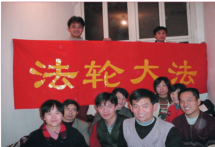
到天安门广场去，微笑地面對磨難，法輪功學員的勇氣令人欽佩