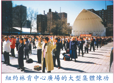
紐約林肯中心廣場的大型集體煉功

總之,在 4.25 中南海事件中,法輪大法學員決不是因為“忍不住”而去“圍攻”中南海,而是祥和地去進行合理合法的上訪。事後的 1999 年 6 月 14 日,中國各大官方媒體同時發佈的《中辦、國辦信訪局負責人接待部分法輪大法上訪人員談話要點》就是這次合法上訪行動的官方證明。政府明確使用“上訪”一詞。當時,法輪大法學員在上訪中表現出的優良素質,和中國政府當時的開明做法,都曾受到外界的好評,認為是中國民主進步的表現。想不到,數月之後,這麼一件好事,被中國一部分領導人,因為個人晦暗的政治需要,運用所控制的宣傳機器,歪曲成了顛覆政府的行動,成了迫害、取締法輪大法的藉口,使中國在政治上倒退到了有些做法比文革還要過份的黑暗年代,使數千萬法輪大法學員的生存受到嚴重威脅。