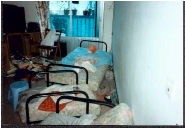
公安非法抄家后留下的劫后情景。