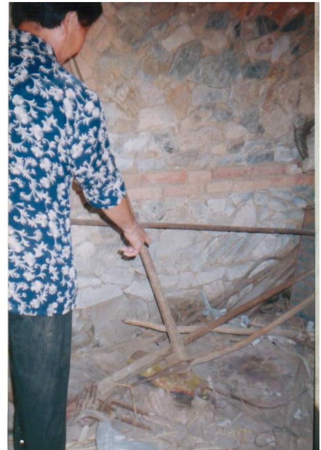
化肥、水泥甚至生活用的麦子、花生、面粉也被抱走