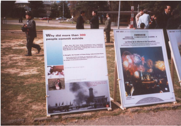
诋毁法轮功的宣传画展(日内瓦)

各国使领馆不仅有诬蔑法轮功的网页，至少有几十种诋毁法轮功的宣传品，煽动对法轮功的仇恨，在包括加拿大在内的至少十五个国家的使领馆举办了诋毁法轮功的宣传画展。