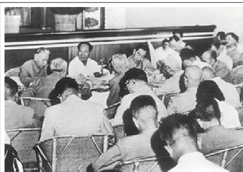
1959 年 7 月 23 日，毛泽东在庐山会议上讲话，批评彭德怀犯了“右倾性质”的错误

“谷撒地，薯叶枯，青壮炼铁去，收禾童与姑。来年的日子怎么过？我为人民鼓与呼！”他通过调查发现“大跃进”的严重问题，便在庐山会议上对“左”的错误提出尖锐批评，因此被打击和撤职。