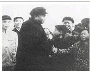
图为 1958 年 12 月，彭德怀在湖南湘潭地区乌石公社进行调查研究

“谷撒地，薯叶枯，青壮炼铁去，收禾童与姑。来年的日子怎么过？我为人民鼓与呼！”他通过调查发现“大跃进”的严重问题，便在庐山会议上对“左”的错误提出尖锐批评，因此被打击和撤职。