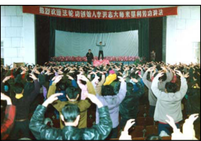
李洪志先生在中国法轮功山东垦利县传授班上讲法传功。山东垦利县 (1994 年 2 月)

法轮功的传出，也给齐鲁这块文明古地带来了惊喜。根据资料记载，1992 年 11 月 16 日至 25 日和 1993 年 5 月 8 日至 17 日，山东法轮功传授班分别在冠县和临清两地举办。参加传授班的人们在九天时间里，初步了解和学习了法轮功的修炼原则、功理和功法。通过不断按照法轮功的修炼标准要求，并不断修炼法轮功五套简单易学的功法，人们很快感受到了法轮功净化身心的强大功效。人们把炼功后体验到的惊喜不断地传播给认识的亲朋好友。1994 年 1 月 28 日至 2 月 5 日和 2 月 11 日至 2 月 18 日，连续两届法轮功传授班在济南经十路 27 号青年干部学院和垦利县县委招待所举办，慕名而来参加传授班的人明显增多。