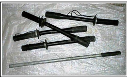
潍坊开发区公安分局警察遗落的毒打法轮功学员的作案工具——四根胶皮警棍和一根铁棍

潍坊的公安、劳教所及精神病院在江××“打死白打，打死算自杀”，“不查身源，直接火化”的灭绝政策和山东省政府对待法轮功“重点防范和打击”的精神政策下，在四年来的迫害中，肆无忌惮地残害法轮功学员，手段无所不用其极，使用的酷刑不下 40 余种：多根高压电棍同时长时间电击，其中包括放在嘴里放电，电击胸部、腋下、乳房、阴部等等；性虐待，晚上拉灭电灯脱下女学员的裤子要流氓（寿光市寿光镇、台头镇；坊子区木村镇等）；形形色色的手铐、背铐；铐死人床、吊铐在门窗上、戴脚镣；麻绳捆（致使其皮肤细胞坏死而植皮，如安丘市、寿光市）；搥耳光、拳头打、皮鞋踢；橡胶警棍、胶皮管、木棍、铝合金片、钢筋条、铁棒