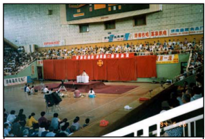
1994年6月21日至6月28日，济南第二期传授班在山东省济南市皇厅体育馆举办。

济南第二期法轮功传授班。这期传授班是李洪志先生在中国大陆举办的最后几期传授班之一，此时法轮功在中国已传遍大江南北。各地有缘之士纷纷闻讯赶来，整个体育馆坐无虚席，有4000多人参加。(1994年6月济南市皇厅体育馆)