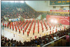
山东省济南市法轮大法修炼心得交流会。中国，济南（1998年）

从此，法轮功“真善忍”的修炼原则和简单易学、功效显著的功法，使得齐鲁人民身心受益，在短短几年内吸引了大批人学炼，真是闻者喜之，相继而来，修者日众。修炼者中有