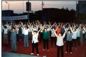
山东省潍坊市部分学员参加全民健身体育表演。山东，潍坊（1997年8月）

农民、工人、商人、军人、教师、学生，也有机关干部、新闻工作者、科技人员、医护人员，还有为数众多的党政军领导干部以及专家、学者、知名人士等各行各业的男女老少。法轮功学员在修炼以后道德回升所展现的精神风貌、工作和生活态度在民众中也有目共睹，得到赞誉。在1999年之前赈灾捐款中，许多法轮学员捐款上万元，而报纸、电视上留下的名字却只有“法轮功学员”。