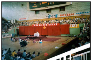
1994年6月21日至6月28日，济南第二期传授班在山东省济南市皇厅体育馆举办。

农民、工人、商人、军人、教师、学生，也有机关干部、新闻工作者、科技人员、医护人员，还有为数众多的党政军领导干部以及专家、学者、知名人士等各行各业的男女老少。法轮功学员在修炼以后道德回升所展现的精神风貌、工作和生活态度在民众中也有目共睹，得到赞誉。在1999年之前赈灾捐款中，许多法轮学员捐款上万元，而报纸、电视上留下的名字却只有“法轮功学员”。