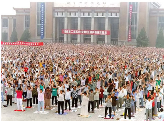
1998年中国沈阳亚洲体育节开幕式上的万人法轮功表演

1999年7月20日之前，整个黑山城内城外，您曾看到：公园绿地、广场、马路边、农家院内、田野旁，几十、成百的人群在做着优美舒缓的动作，氛围祥和庄严，给黑山城乡增添了无比清新、高尚、充实的内涵与无上和协祥瑞的新貌。法轮功引领着人们走出生命的迷惘，在全新的一切中去获得真正的纯清与永恒。对“真、善、忍”的信仰，带给人们无比的祥和、轻松、高尚。人们因修炼法轮功而无疾无病，人们因信仰“真、善、忍”而无私无恨。法轮功既是一种十分有效的健身功法，又是一种十分崇高的信仰。人们纷纷走入炼功人的行列。