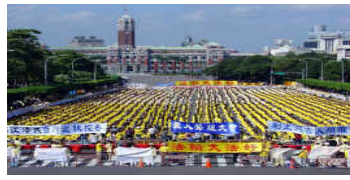
2003 年 11 月 15 日台北总统府前万人静坐声援控诉江泽民