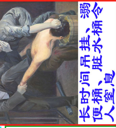
长时间吊挂、溺便桶、脏水桶令人窒息