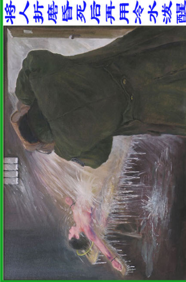
将人折磨昏死后再用冷水泼醒