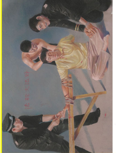
长长的竹签被从指甲下钉入指尖