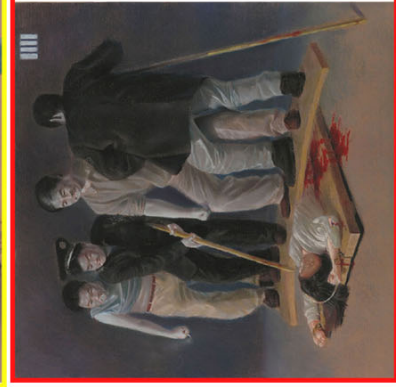
年轻妇女受到的摧残之一