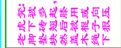
老虎凳：老脚垫块，老虎下砖多起，脚垫块后翘起，然后被用或向压盖木绳下狠