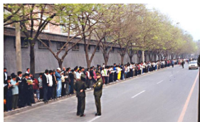
法轮功学员没有阻塞交通，静静的站立等候十几个小时。

因为罗干设下圈套，事先封闭各路口唯独留下中南海一条路，公安刻意诱导学员分为两路把中南海围成一圈形成所谓的“包围中南海”进行栽赃陷害。