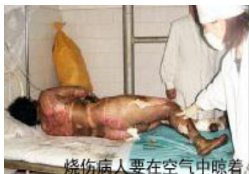
烧伤病人要在空气中晾着

Z医生表示非常不可思议：“那么重的烧伤病人怎么可能不進无菌室？记者怎么也不穿防护服？”