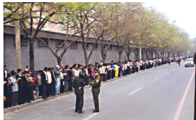
法轮功学员没有阻塞交通，静静的站立等候十几个小时。

因为罗干设下圈套，事先封闭各路口唯独留下中南海一条路，公安刻意诱导学员分为两路把中南海围成一圈形成所谓的“包围中南海”进行栽赃陷害。