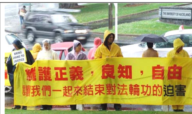
图为来自澳大利亚、新西兰和台湾等地的法轮功学员冒雨在奥克兰高等法院前筑起勇气的长城，支持诉讼。

世界各国政府、议员、团体组织等纷纷对法轮大法和创始人颁发褒奖及感谢，已达 1223 项。其中美国 1051 项，加拿大 135 项，澳大利亚 12 项，台湾 9 项，中国 99 年以前 6 项，欧洲 6 项，新西兰、日本、印度尼西亚、秘鲁各一项。