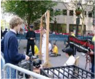
很多媒体聚焦法轮功真象，久久不愿离去。

约八年前，瓦西留斯意外地接触到法轮功并开始了孜孜不倦的修炼。” 联合国大楼前酷刑展 揭露江集团的罪恶 【明慧网2004年9月24日】（明慧记者黄凯莉纽约报道）目前，第59届联合国大会正在纽约召开。为了让来自各国的首脑和代表们了解法轮功以及在中国正在发生的残酷迫害，世界各地的法轮功学员纷纷来到纽约，在联合国大楼前和曼哈顿街头举办反酷刑展、征签等活动，呼吁制止江氏集团迫害法轮功，并要求法办江泽民。联合国安理会主席的一位秘书说，在街上接到真象传单，了解到法轮功学员在中国遭到的迫害；他表示一定会把支持审江的签名表及时转交给安理会主席。很多路人看到酷刑演示和图片展，不禁停下匆匆的脚步，了解真象，并签名支持制止迫害。一位西方女士说，迫害法轮功的一定是个极坏的人，它应受到制裁。