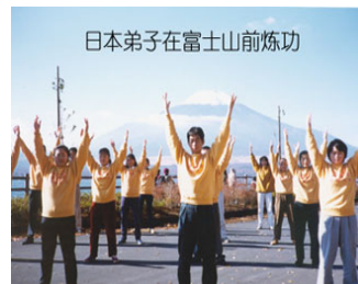
日本弟子在富士山前炼功