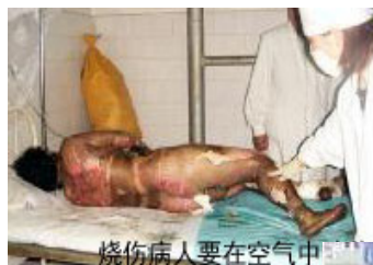
烧伤病人要在空气中

他身上烧的挺厉害，有的地方褪掉一层死皮，露出新的肉皮，手上烧的像戴手套一样。特别是后背烧的更重，烧伤处涂着药，结了大面积的痂了，有的痂与痂之间还在往外流血水。