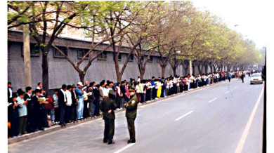
法轮功学员没有阻塞交通，静静的站立等候十几个小时。

上访的起因： 江 XX、罗干一伙先是利用何作麻等人诽谤宣传挑起事端，后于 99 年 4 月 23 日指使天津公安殴打、抓捕 40 多名法轮功学员，公安部介入天津市，并告知没有北京的授权不放人，建议学员去北京上访。学员们基于对政府的信任，用宪法 41 条赋予的上访权，本着善念，希望政府能公平对待法轮功 4 月 25 日当天，上万名闻讯而来法轮功群众没有口号、没有标语，安静而有序地等候了十几个小时。总理朱镕基接见了学员代表，下令天津公安局放人，并重申了国家不会干涉群众炼功的政策。当晚 10 点，学员们悄然离去。整个过程，平静祥和，秩序井然。上万人离开后，地上干干净净没有留下一片纸屑。