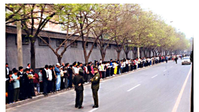
法轮功学员没有阻塞交通，静静的站立等候十几个小时。

上访的起因： 江 XX、罗干一伙先是利用何作麻等人诽谤宣传挑起事端，后于 99 年 4 月 23 日指使天津公安殴打、抓捕 40 多名法轮功学员，公安部介入天津市，并告知没有北京的授权不放人，建议学员去北京上访。学员们基于对政府的信任，用宪法 41 条赋予的上访权，本着善念，希望政府能公平对待法轮功 4 月 25 日当天，上万名闻讯而来法轮功群众没有口号、没有标语，安静而有序地等候了十几个小时。总理朱镕基接见了学员代表，下令天津公安局放人，并重申了国家不会干涉群众炼功的政策。当晚 10 点，学员们悄然离去。整个过程，平静祥和，秩序井然。上万人离开后，地上干干净净没有留下一片纸屑。