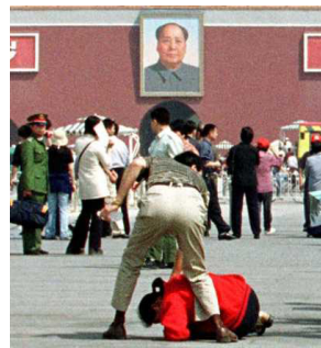
天安门广场上的暴行

2001 年 7 月 21 日的中午，天气非常炎热。天就象要下火一样，整个广场也见不到几个人，其中一半是执勤的便衣警察。我来到广场中间的一个大灯柱的后面坐下乘凉。不一会儿，有一个中年妇女走了过来。一看就知道是法轮功学员。只见她把手中的遮阳伞放在地上，挡住前面，随后坐下，并脱了鞋，打起坐来，炼起了法轮功。可没有两分钟，警车就开过来了。两个警察跳下车跑过来。一人拽一