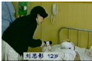
▲ 记者的装扮足以导致“自焚者”感染死亡。

烧伤部位不能用绷带或布包裹，这是一般人都知道的医学常识；另外接触重度烧伤病人必须穿隔离衣、戴口罩、帽子，否则出现致命的感染。