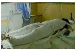
▲ 《焦点访谈》中的“自焚者”却被包裹得严密。