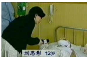
▲ 记者的装扮足以导致“自焚者”感染死亡。

烧伤部位不能用绷带或布包裹，这是一般人都知道的医学常识；另外接触重度烧伤病人必须穿隔离衣、戴口罩、帽子，否则出现致命的感染。