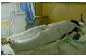
▲ 《焦点访谈》中的“自焚者”却被包裹得严密。