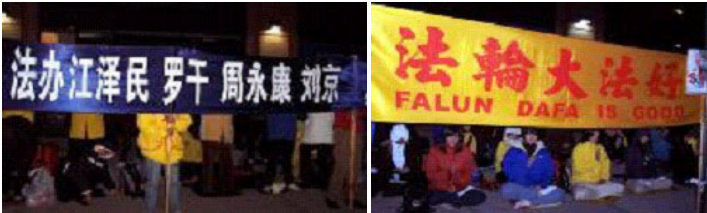
横幅表达了法轮功学员的心声 中领馆前烛光守夜

【明慧网 2004 年 11 月 4 日】2004 年 11 月 3 日晚，三百多位法轮功学员陆陆续续来到位于纽约曼哈顿中城的中领馆左侧的大道上举行烛光守夜，呼吁制止在中国发生的对法轮功的迫害，法办江泽民、罗干、周永康、和刘京等迫害法轮功的主要凶手。