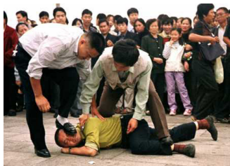
天安门广场上的暴行

字喊到一半的时候就被从后面过来的警察一棒打倒。警察的嘴里还骂着：“老家伙，找死！”又过来一个警察把老人家扔进了车里。在我边上有几个外国人，他们用相机正在拍照，被警察发现了，他们的相机被警察抢走了，警察把胶卷曝光了，一边骂道“老