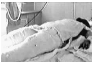
中央电视台“天安门自焚案”中的镜头：“烧伤病人”全身包裹。