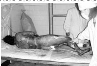
真正的烧伤病人要在空气中晾着，护理人员要穿卫生服，戴口罩防感染。