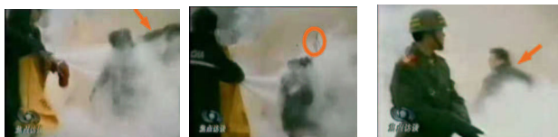
1, 刘头部受重击 2, 击打后飞出的重物 3, 打击者用力姿势

有人用重物击打刘春玲头部该重物迅速弹起。一穿军大衣者站在出手打击的方位仍保持着力用的姿势