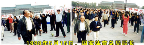
1998年5月15日，国家体育总局局长伍绍祖亲赴法轮大法发祥地长春考察