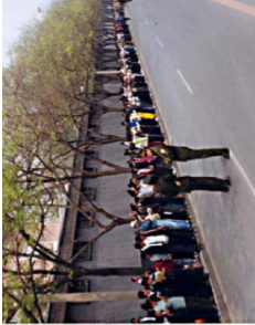
上访学员安静祥和 警察闲聊聊天

1999年4月25日，一万多名法轮功学员到中南海附近的国务院信访办上访，是因为4月23日天津公安殴打、抓捕40多名法轮功学员，天津市政府的官员告诉学员，要说明情况就要找北京的中央政府。学员们抱着信任政府的诚意和澄清误解的心愿，希望政府能公平对待法轮功。总理朱镕基接见了学员代表，下令天津公安局放人，并重申了国家不会干涉群众炼功的政策。国际媒体对此给予了高度评价，认为“4.25”是中国政治民主，政府开明的里程碑。