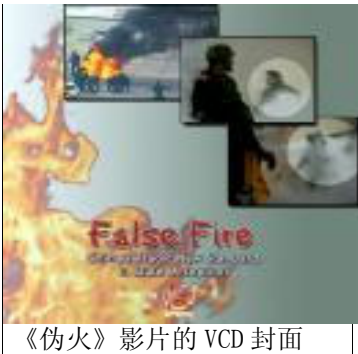
《伪火》影片的 VCD 封面

2003年11月13日，分析2001年天安门自焚事件的影片《伪火》(False Fire) 获第51届哥伦布国际电影电视节荣誉奖。该片是由北美非盈利民间中文电视台“新唐人”制作的。颁奖仪式于11月8日在俄亥俄州哥伦布市的哥伦布艺术设计学院坎萨中心举行。