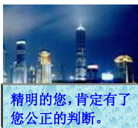
精明的您,肯定有了您公正的判断。

五,医生说孩子呼吸道严重烧伤,做了气管切开手术,可是孩子居然在术后就清脆地说话和表演儿歌,割开的喉咙会唱歌,这是为什么?