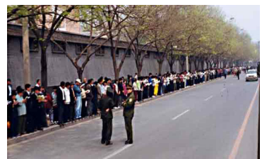
法轮功学员没有阻塞交通静静的站立等候十几个小时离开时把环境清理的干干净净