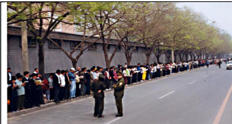
学员没有标语口号没有阻塞交通 等后十几个小时离开时把环境清理的干干净净。

1998 年下半年由前人大委员长乔石所主持的对法轮功的官方调查得出的结论是:“法轮功于国于民有百利而无一害”。98 年国家体委官方统计:当时全国有 7 千万人修炼法轮功,超过了共产党党员的人数。