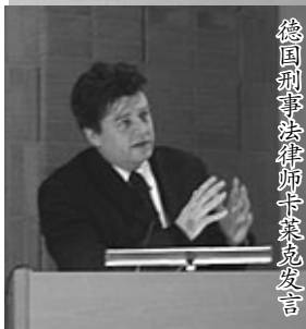
德国刑事法律师卡莱克发言